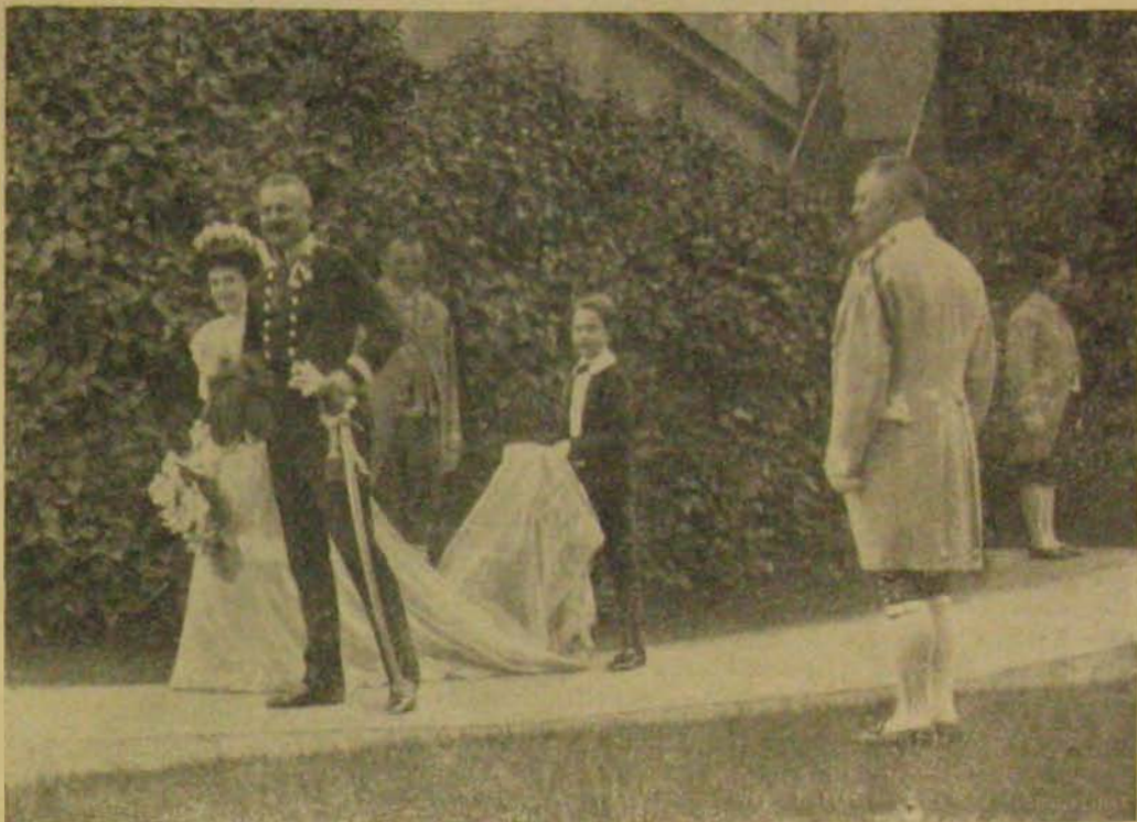
Lakodalom Frigyes főherceg családjában, a weilburgi kastélyban. — A mátkapár az esküvő után.

fejleszt és az ágy közelében talált paprikás zsákok egyikét is, mert azokon is vérnyomokat fedeztek fel.