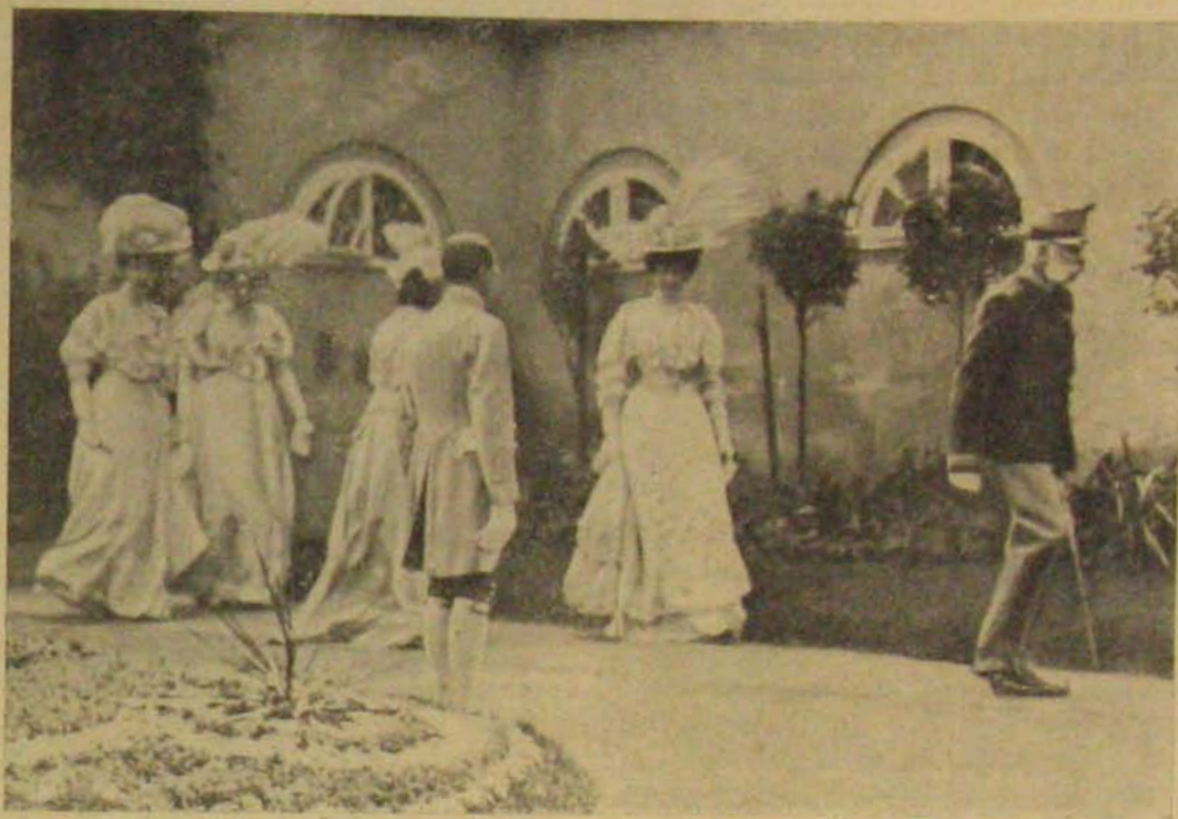
A király az esküvőre megy.