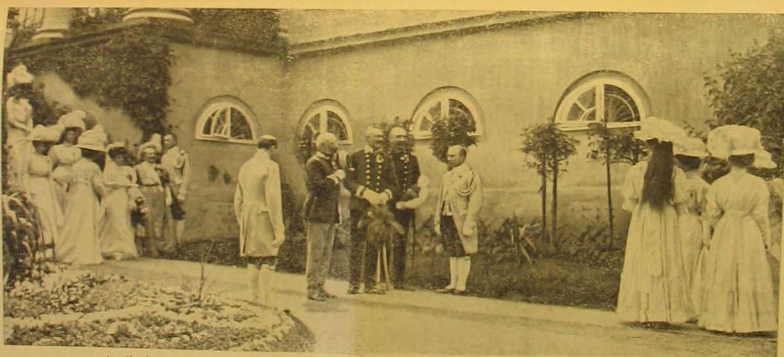
A vőlegény, Hohenlohe Gottfried herceg Frigyes főherczeggel és bátyjával, Hohenlohe Konrád herczeggel.