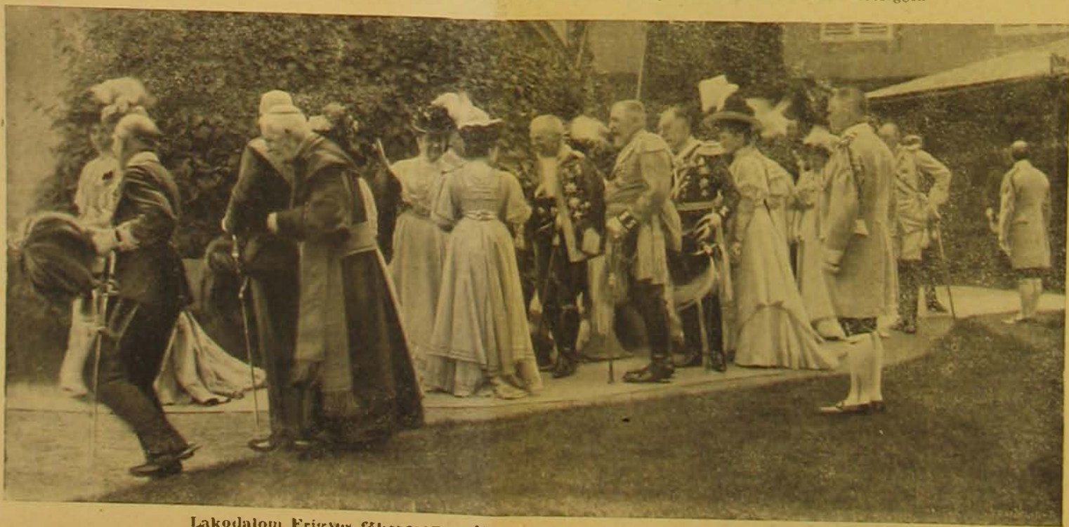
Lakodalom Frigyes főherczeg családjában, a weilburgi kastélyban. — A náaszóp.