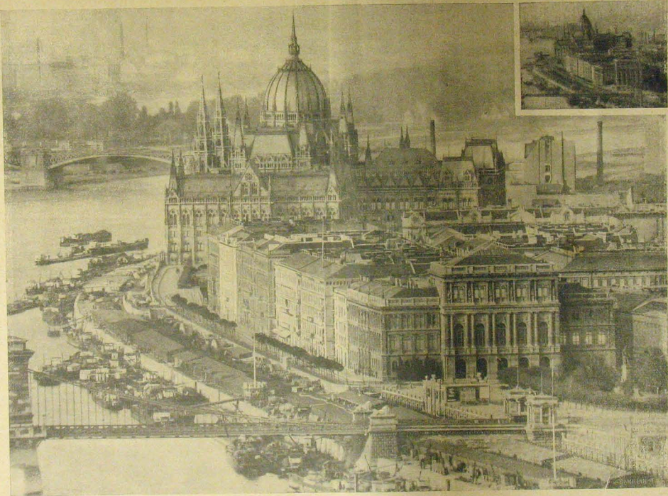
Az országház és környéke a gellérthegyzi ezitadellától táveső-lencsével felvéve.

Ugyane kép ugyanonnan rendes lencsével felvéve.