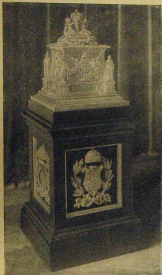
A királyné koronázási ajándékának szekrénye.