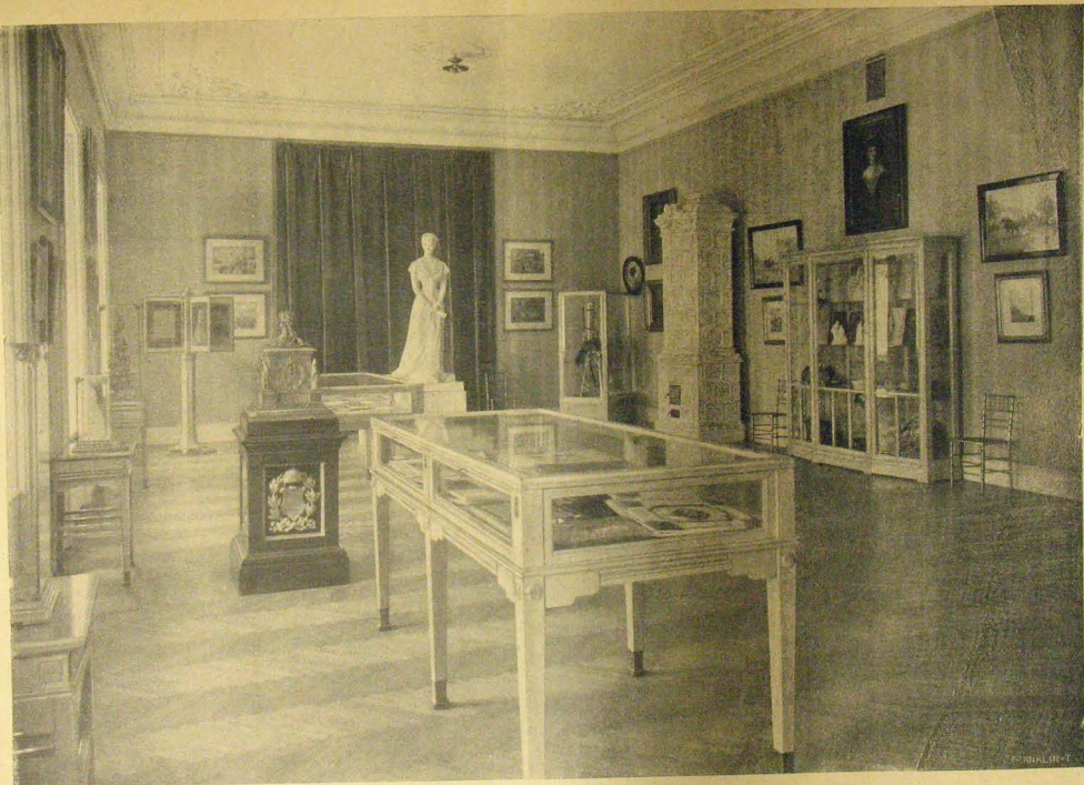
A nagyterem az Erzsébet királyné emlékmuzeumból.