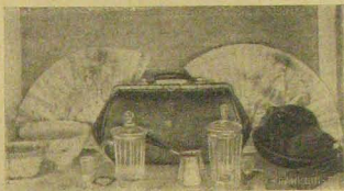
Legyezők, utításka s teázó-készlet, melyben a királyné maga készítette teáját.