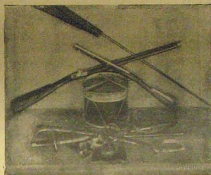
Rudolf trónörökös gyermekkori játékserei.

A budavári Erzsébet királyné emlékmuzeumból.