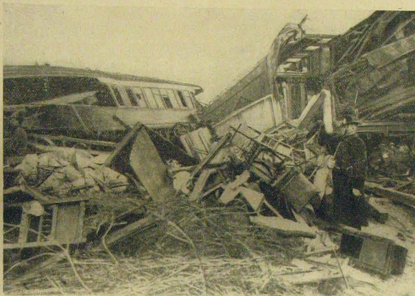
Az űtkező kocsí.