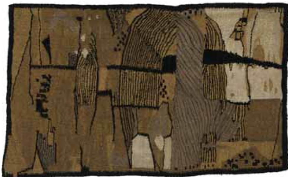
Owidzka, Jolanta: „Mese”, 1964 ok./gobelin; manilakender, nylon-6, gyapjú, szizál, 120 x 198 cm CMW 2694 / w / 275