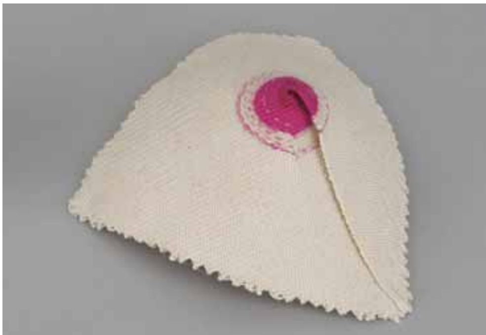
Domańska, Emilia: „Tárgy”, 2009 / gobelin, formázás, varrás; len, gyapjú, pamut, 8,5x19x19 CMW 17281 / w / 1944