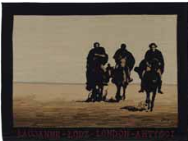
Popławski, Stefan: „Lausanne-Lódź-London – Művészek”, 1977–79 / gobelin; len, gyapjú, 196 x 267 cm CMW 8906 / w / 953