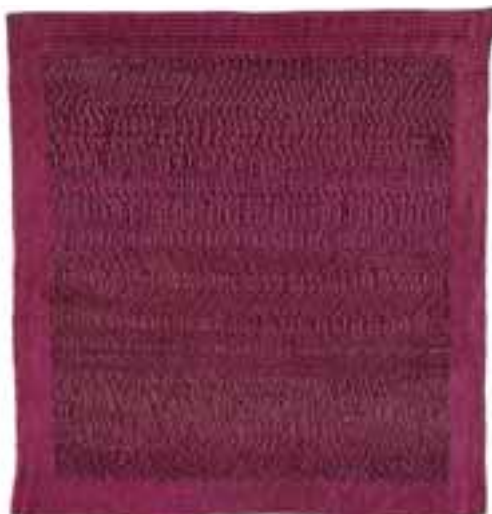
Rudzka, Habisiak Jolanta: „Dombormű IV”, 1988 / saját technika; len, bőr, 196x186 cm CMW 10751 / w / 1234