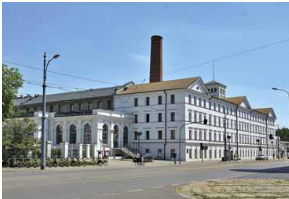
A Łódźi Központi Múzeum (az ún. Fehér Gyár)