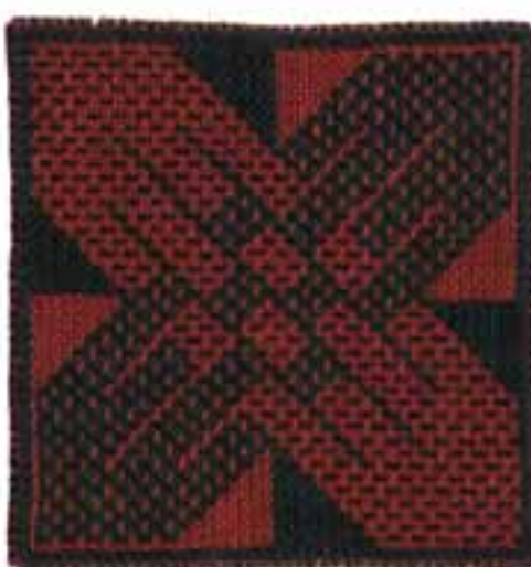
Tomasziewicz, Bolesław: „Tandem II és 8 háromszög”, 1997 / dublé; gyapjú, 22,2x21,1 cm CMW 18554 / w / 2005