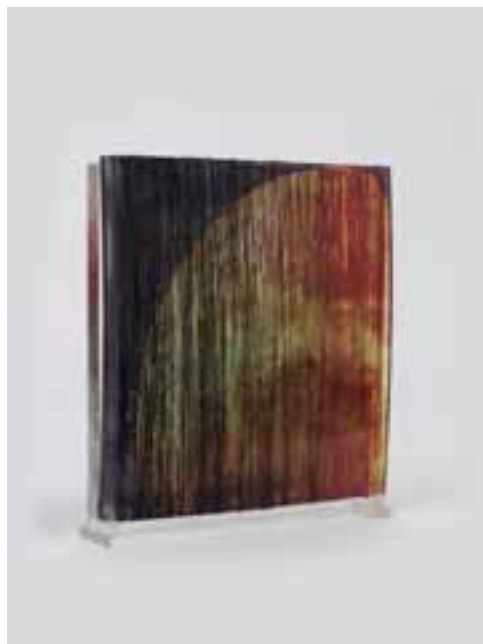
Wyrwa, Izabela: „Bolygó 02”, 2014 / transzfer nyomtatás, tekerés, ragasztás; plexi, szintetikus rost, 15 x 15 x 2 cm CMW 20854 / w / 2343