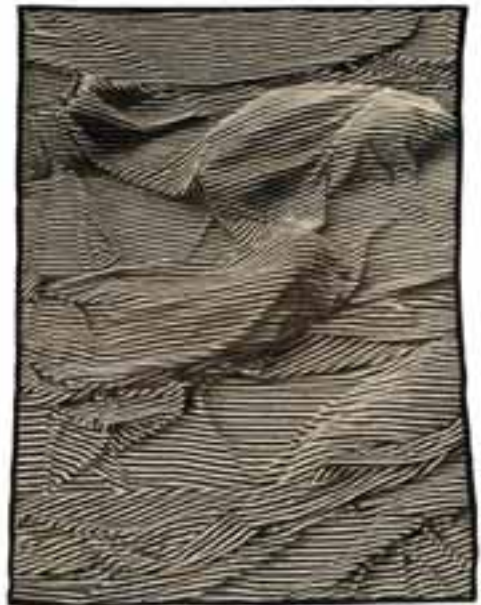
Rajch, Andrzej: „Három grácia” , 1985 / gobelin; len, gyapjú, 268x204 cm CMW 9795 / w / 1092