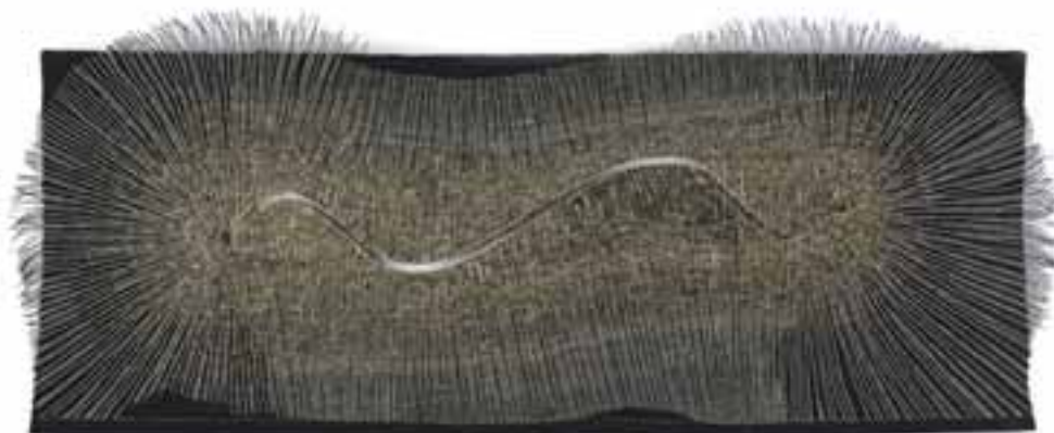
Cygan, Włodzimierz: „Ellipszisjáró”, 2006 / gobelin; gyapjú, pamut, szizál, nájlonfonál, polipropylen, 117 x 290 cm CMW 17683 / w / 1971