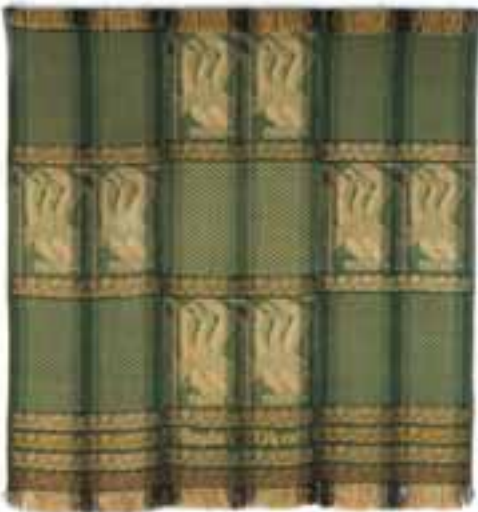
Kintopf, Lucjan: „Olimpiai sasfőőkák”, 1934 / „Ład” Művészszövetkezet, Varsó jacquard; len, 242x246 cm CMW 13622 / z / 1603