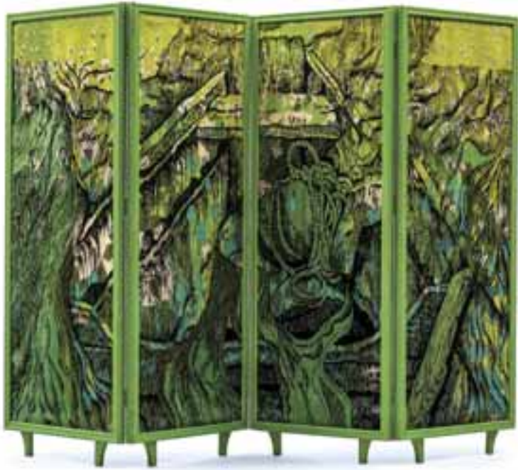
Tworek-Pierzgalska, Janina: Krimi szonett , 1972 / gobelin technika; len, gyapjú, fa keretek, 180x300 cm CMW 6218 / w / 554