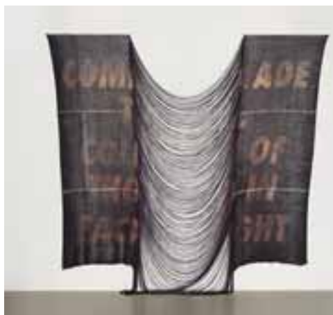
Younger, Alex: „Solidarity”, 2017 / monoprint laza szövésű szöveten; bambuszfonál, 271 (do 242) x 285 (do 368) x 18 cm CMW 23401 / w / 2420