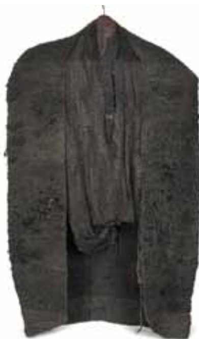
Abakanowicz, Magdalena: „Fekete ruha VI”, 1976/kevert technika; len, szizál, fémkeret, 330x200x100 cm CMW 7307 / w / 759