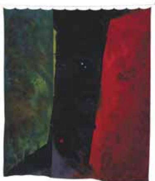
Trzeszkowski, Stanisław „Az elveszett éden kapuja”, 1997 / festett selyem CMW 12388 / w / 1356