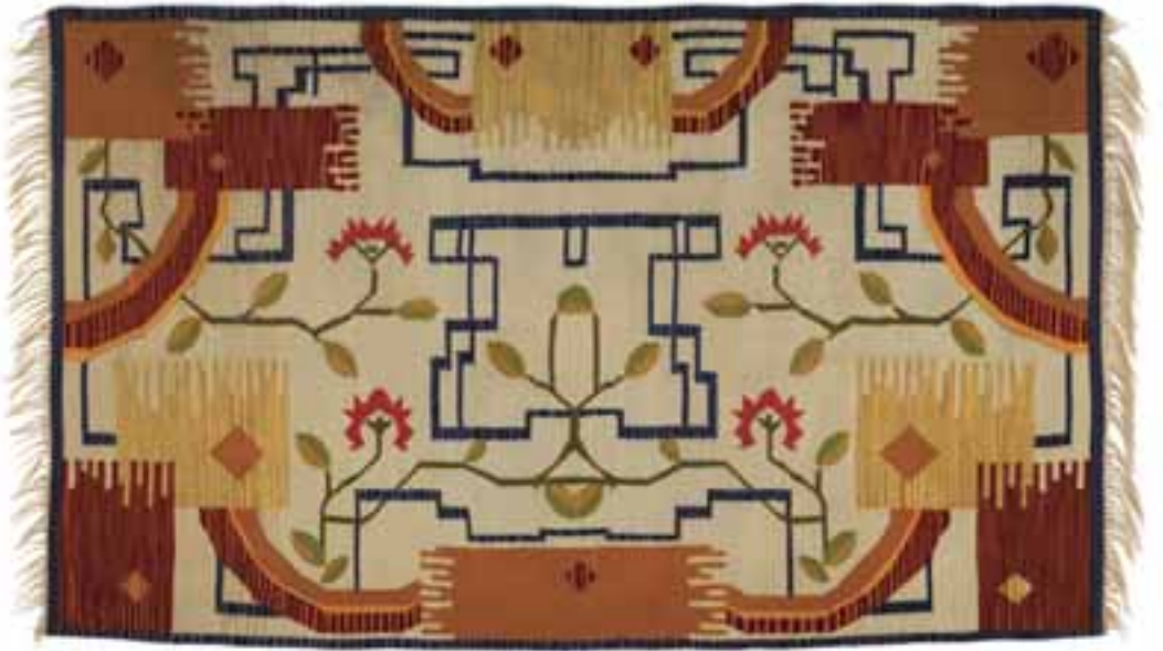
Kilim geometrizált ágmatívumokkal, 20. század '30-as éveit / kilim; len, gyapjú, 149x248 cm CMW 8763 / z / 1112