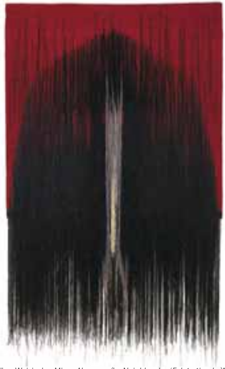
Sadley, Wojciech: „Missa Abstracta (La Nuit blanche / Fehér éjszaka)”, 1966 / kevert technika: gobelin, fonalhímzés; len, gyapjú, 320x200 cm CMW 5748 / w / 421