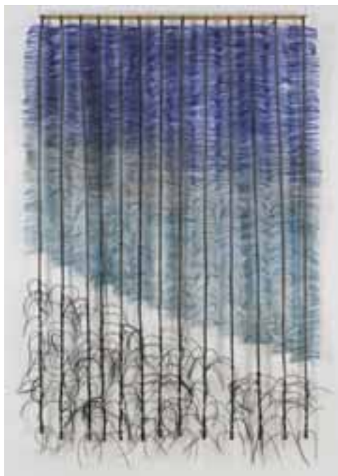
Kowalewski, Bogusław: „Megállítani a szelet XII”, 1992 / kevert technikák; bőr, szintetikus fonál, fa, 230x127 cm CMW 13121 / w / 1392