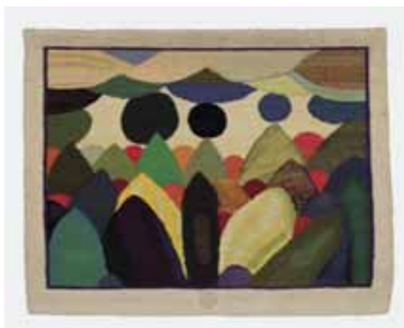
Dominik, Tadeusz: „Absztrakt táj (fehér bordúnell)”, 1986 / gobelin; len, gyapjú, 158 x 200 cm CMW 19032 / w / 2117