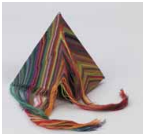
Zych, Konrad: „Kiömlött”, 2015 / gépi hímzés, varrás; céna, filc, 14 x 13 x 16 cm CMW 20859 / w / 2348

művésztől származó, nagyjából 250 kompozíciót. A kortárs textilművészeti kollekción jelenleg közel 2400 alkotást számlál. Október 8-án megnyitják a 17. Miedzynarodowe Triennale Tkaniny-t (17. Nemzetközi Textiltriennálé). Kívánunk a múzeumnak sok sikert a rendelkezésre álló eszközök kihasználása terén, valamint jószándékú alkotókat, hogy az értékes, a '60-as évek óta gazdagodó gyűjtemény továbbra is bemutathassa a legújabb alkotásokat.