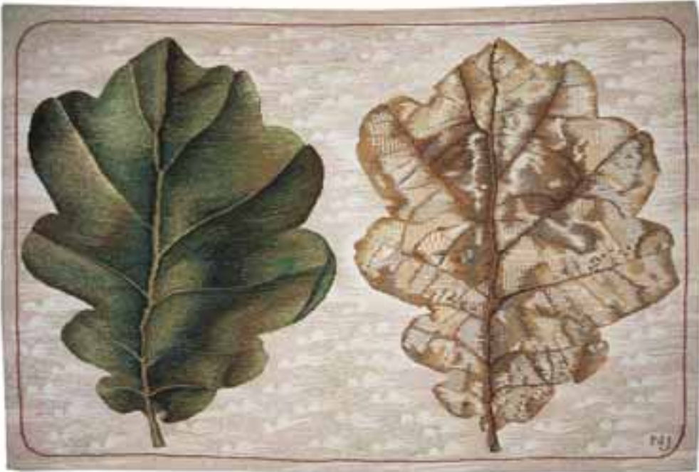
Nagy Judit: Átváltozás , 1979/gyapjú, selyem, fémszál, 4,5-ös felvetés, 90x110 cm (Szombathelyi Képtár)