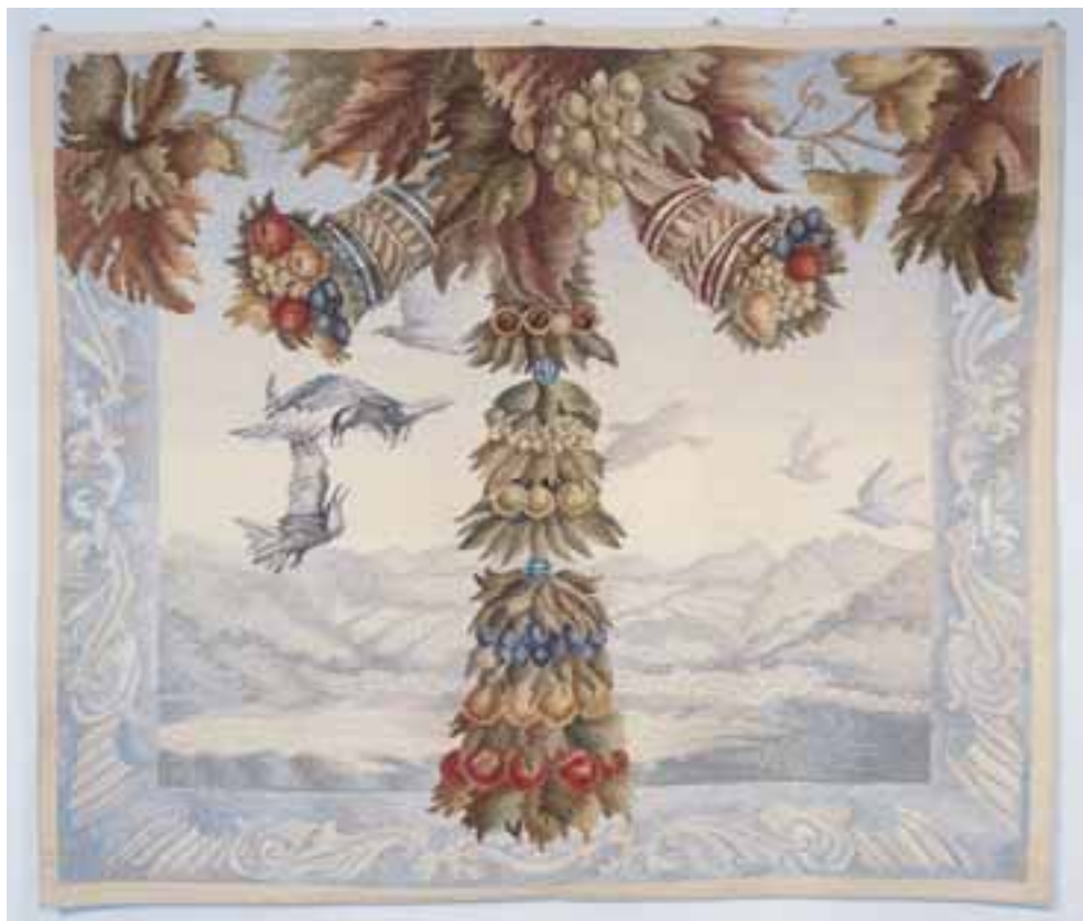
Nagy Judit: Bőség 1984/gyapjú, selyem, fémszál, 4-es főtvetés, 160x150 cm (Iparművészeti Múzeum, Budapest)