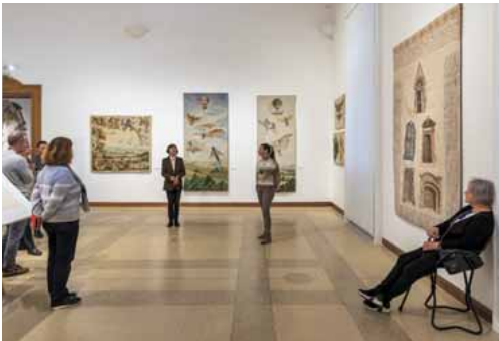
Tárlatvezetés Nagy Judit kiállításán.