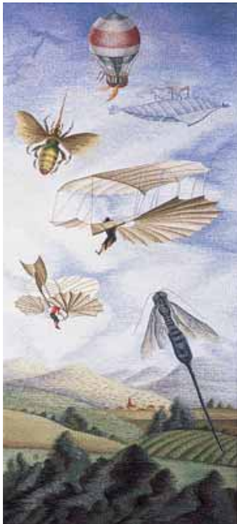
Nagy Judit: A repülés története, 1981 / gyapjú, selyem, fémszál, 4,5-ös felvetés, 326x110 cm

utaló 1980-as Szövés = életmód , vagy az olyan, szintén trompe l'oeil hagyományokat követő munkák, mint az Oleander szender (1978) és a Szarvasbogár (1980), a gobelin fénykorát jelentő művészettörténeti korokra is utalnak. De a kárpit igazi, modern nyelvét még felfedezni képtelen, azt elnyomó festészet műfajára is. Szerényen visszafeleselve, sőt demonstrálva, hogy a gobelin formanyelvén is lehet trompe l'oeil-t csinálni.