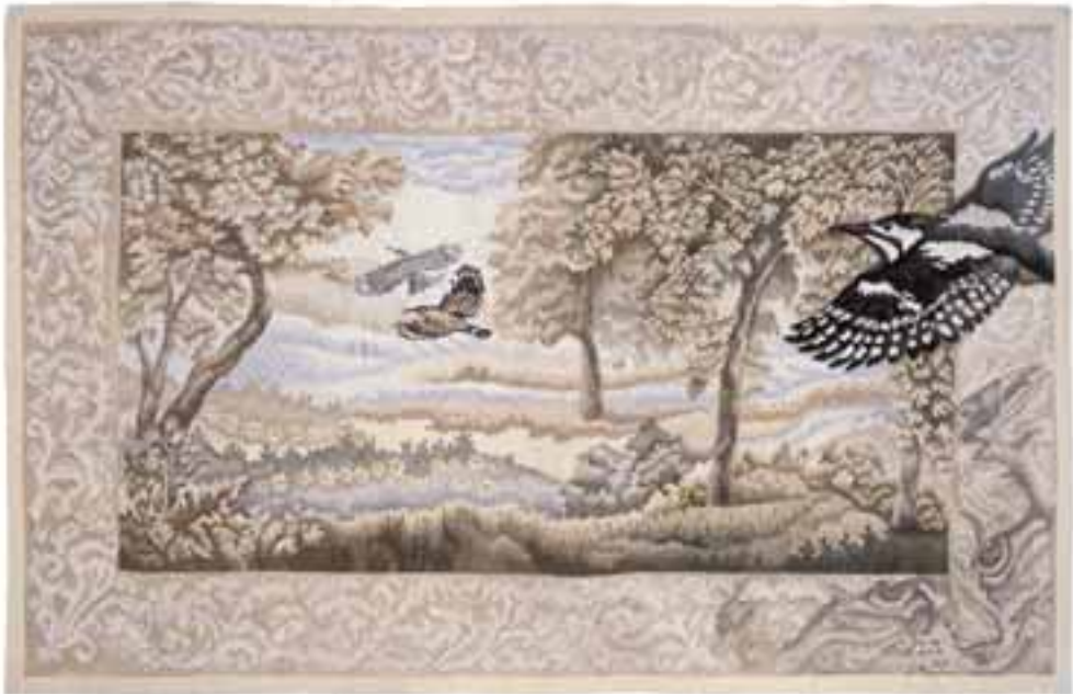
Nagy Judit: Keleti Károly utca, 33 , 1986 / gyapjú, selyem, fémszál, 4-es fölvetés, 160x150 cm (Iparművészeti Múzeum, Budapest)