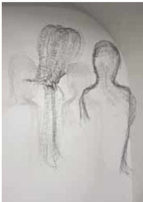
T. Doromy Mária: Dialógus , 2011 / drótszál, egyedi drótszövés, 140x140x30 cm