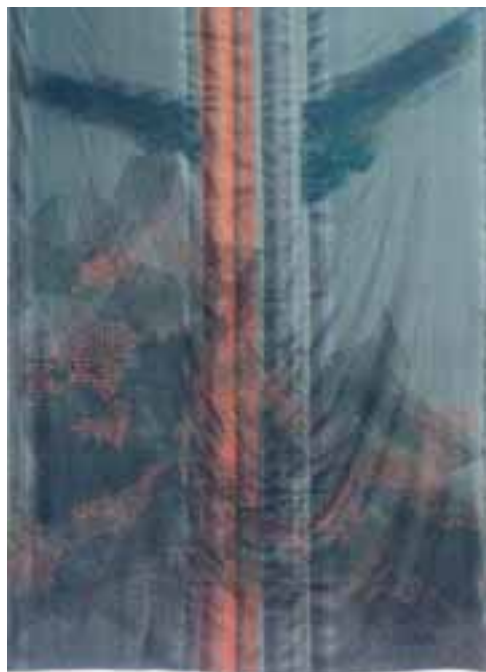
T. Doromy Mária: Niké , 1987 / laufervászon, szitanyomat, festés, 260x400 cm