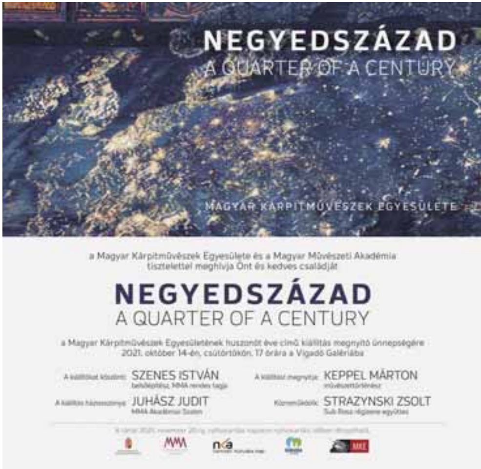
A Negyedszázad-kiállítás meghívója és a Magyar Kárpitművészek Egyesülete művészei