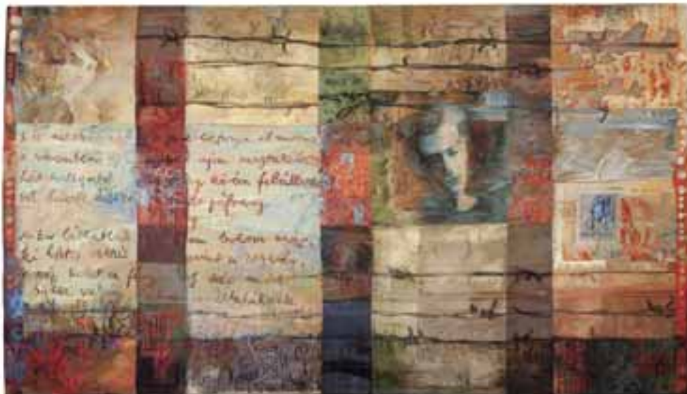
Közös munka: Hommage à Radnóti , 2013–2014 / haute-lisse, szövött falikárpit, 145x270 cm (Holokauszt évfordulóra készített mű, M.K.E.)