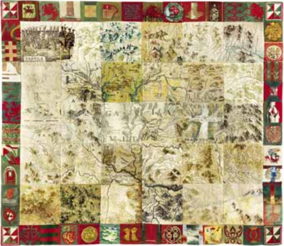
Közös munka: Kárpit határok nélkül , 1995–96 / haute-lisse, szövött falikárpit, 300x350 cm.

közönség elé legújabb alkotásaikat, s ezeken a bemutatásokon a magyar alkotók munkái a nemzetközi kárpitművészeti törekvések összképét reprezentáló műegyüttes művészeti közegében, összefüggérendszerben jelenhettek meg. Úgy vélhetjük, hogy e tárlatok az egyetemes és magyar kárpitművészetnek az ezredforduló éveiben zajlott-lezajló törekvései felmutatásában fontos tájékoztató és sarokpontokká váltak. Különleges, minden bizonnyal a Magyar Kárpitművészek Egyesülete egyedülálló