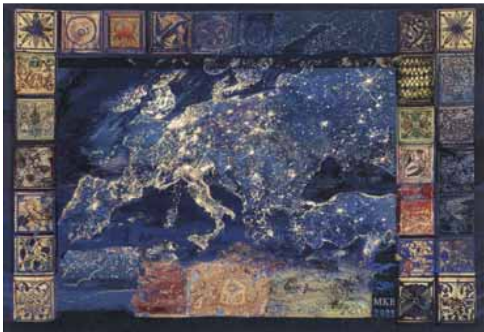
Közös munka: European Universum , 2020–2021 / haute-lisse, szövött falikárpit (Európa Tanács, Strasbourg)