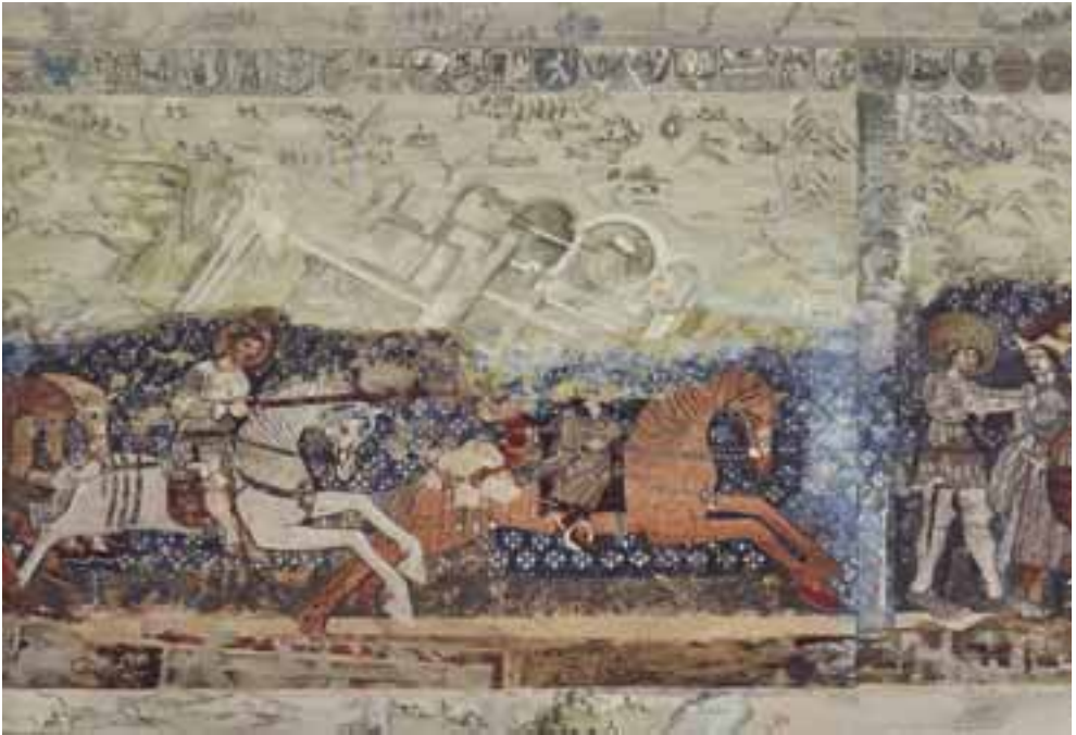
Közös munka: Szent László kárpit-részlet, 2017–2019 / haute-lisse, szövött fallikárpit, 200x768 cm (Külgazdasági és Külügyminisztérium)