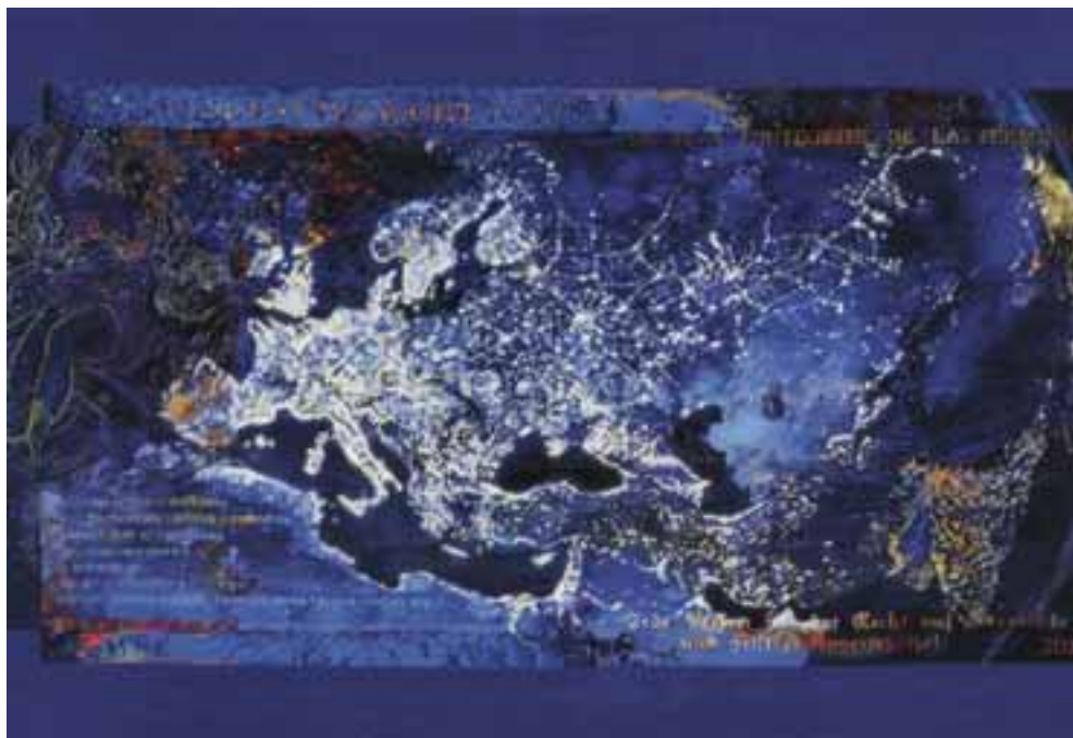
Közös munka: Európa fényei , 2009–2011 / haute-lisse, szövött falikárpit (Külgazdasági és Külügyminisztérium) 216 x 400 cm