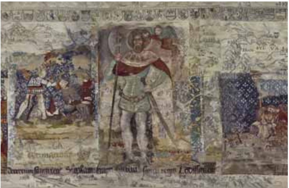
Közös munka: Szent László kárpit részlet, 2017–2019 / haute-lisse, szövött fallikárpit, 200x768 cm (Külgazdasági és Külügyminisztérium)