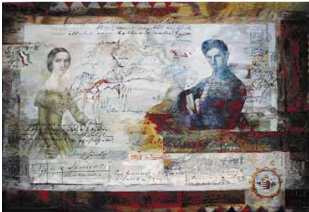
Közös munka: Az egész töredéke a töredékek egésze (Petőfi-kárpit), 2012–2013 / haute-lisse, szövött falikárpit, 180x270 cm (Petőfi Sándor Szülőház és Emlékmúzeum, Kiskőrös)