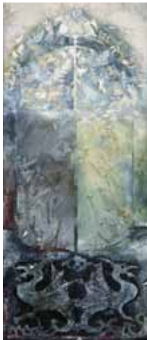
Mádér Indira: „A Mindent Mozgatónak glóriája...”, 1998 /haute-lisse; gyapjú, selyem, 221x96 cm Fotó: Mádér Indira