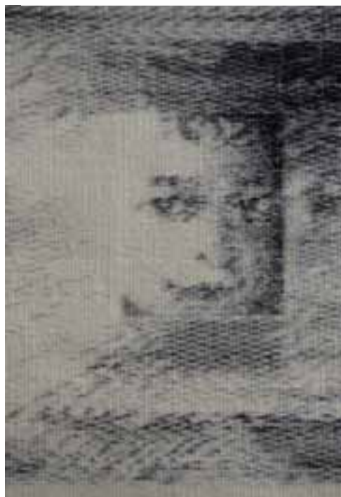
Pápai Livia: Földelés (részlet) 1984 / haute-lisse és egyéni technika; gyapjú, 100 x 70 cm