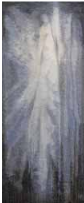
Hager Ritta: „...és fölméne...”, 1990 /vegyes felvetésű falikárpit; gyapjú, len, 200x80 cm