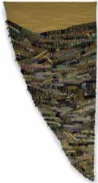
Baráth Hajnal: Töredék az Aranykorból , 1992 /haute-lisse és egyéni technika; gyapjú selyem, fémszál, 180x70 cm