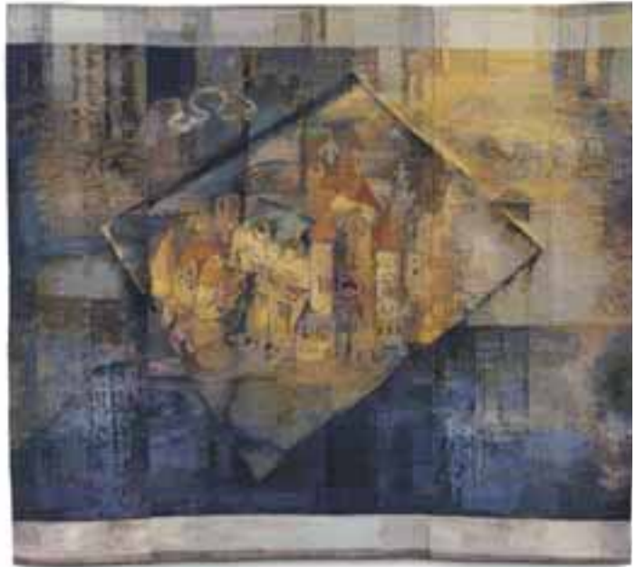
Balogh Edit: Mennyei Jeruzsálem , 2016 /haute-lisse; gyapjú, selyem, fémszál, 170x192 cm