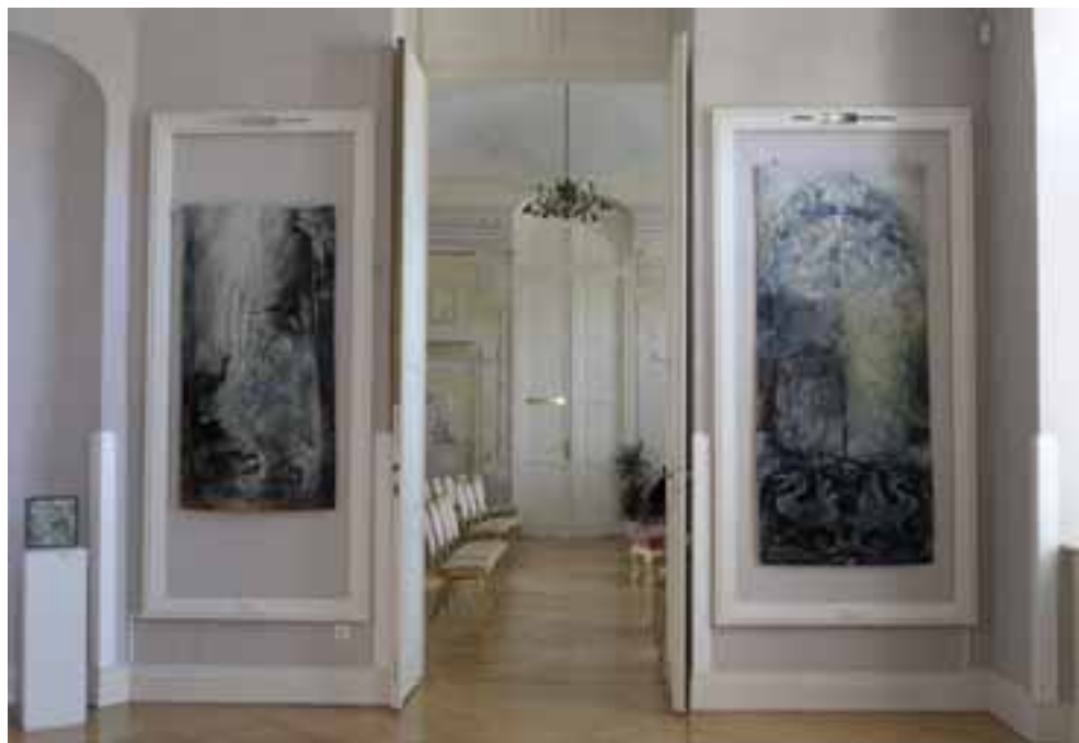
Enteriőrök a kiállitásból