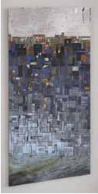
Csókás Emese: Repülés , 2018 /haute-lisse és egyéni technika; gyapjú, pamut, fémszál, antikolt, cinklemez, vaslemez, 150x90 cm