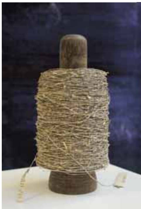
Pápai Livia: Cséve , 2008 / textil-objekt; brevium romanum szeletelt, sodort lapjai, fa, 26 cm x 15 cm x 15 cm