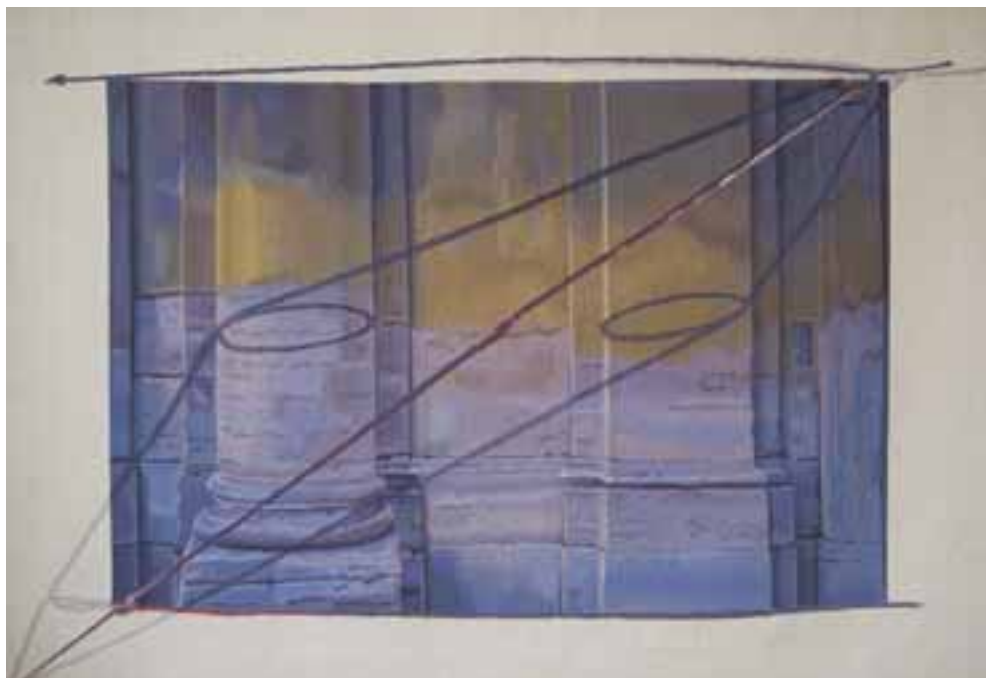
Pasqualetti Eleonóra: Inflexió , 2000 /haute-lisse; gyapjú, selyem, fémszál, 165x223 cm