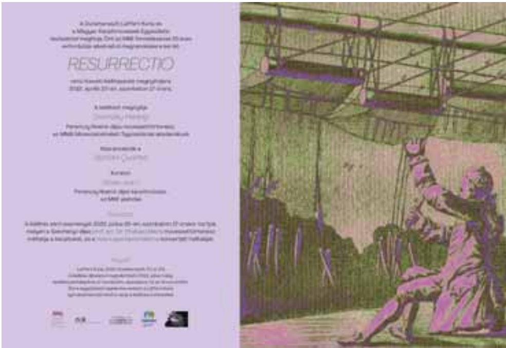
A Resurrectio-kiállítás meghívója és a kiállító művészek