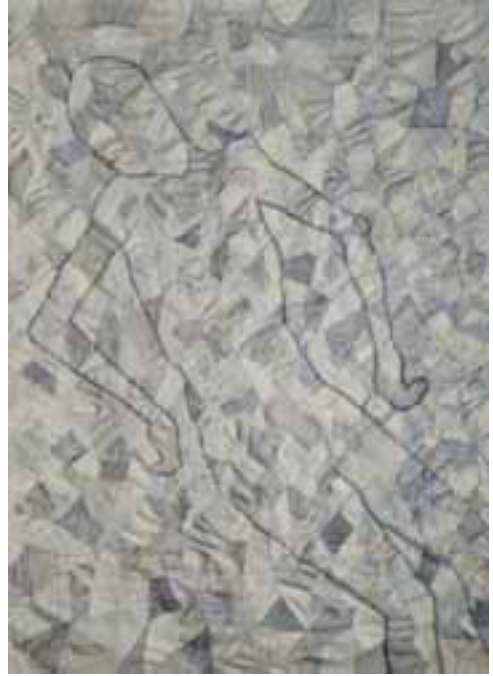
Hauser Beáta: Végül , 2011 /haute-lisse; gyapjú, 200x150 cm