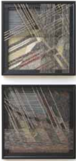
Kneisz Eszter: Hálózatok II-III , 2009 /szálkihagyásos szövés; gyapjú, fémszál, fa, 62x62 cm