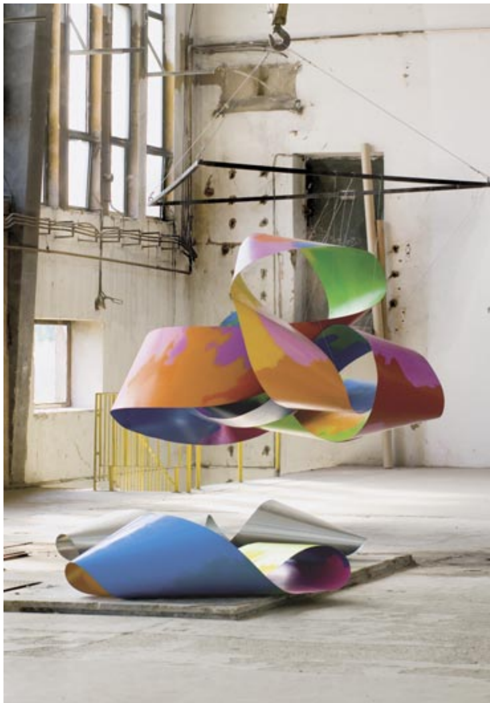
Ilona Keserü Ilona: Nagy színváltó gubanc , 2007. (olaj, titán-ötvözet, 250x450x300 cm)