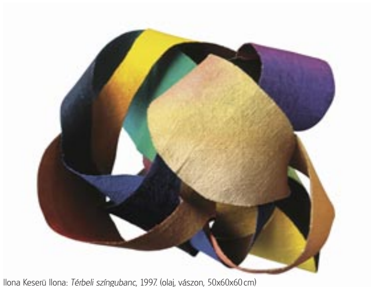
Ilona Keserü Ilona: Térbeli színgubanc , 1997. (olaj, vászon, 50x60x60 cm)