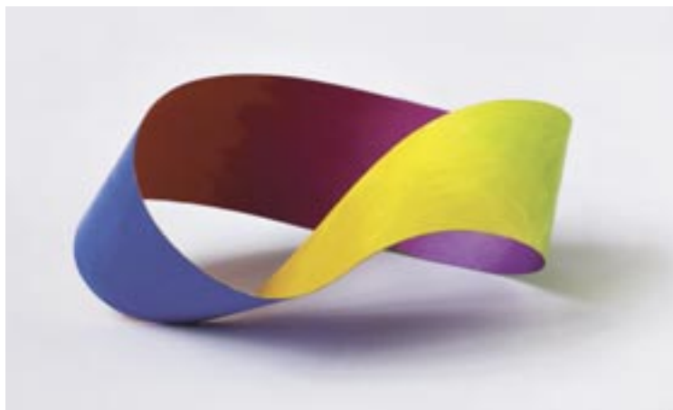
Ilona Keserü Ilona: Titán Möbiusz , 2006. (olaj, titán ötvözet, 42x35x20 cm)