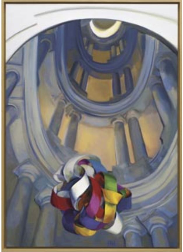
Ilona Keserű Ilona: Borronomi lépcső , 2005. (olaj, vászon, 150x100 cm)

installációs formát a kép részeként megfestve szerepel a színsávokat sorrendben megjelenítő fel-függesztett gubanc; ezek a Borronomi lépcső , 24 ahol egy reneszánsz kupolában lebeg egy színes, majdnem gömböt formáló, hajlított szalag, és az Energiamozgás önarcképpel , 25 ahol a fehér és szürkés színekkel megjelenített művész kezével a színes, függő, csavart színszalag felé mutat. Azért is érdekesek ezek a művek, mert a reneszánsz és a barokk festői, szemléleti tradícióra egyaránt utalást tesznek, akár egy-egy műalkotáson belül.