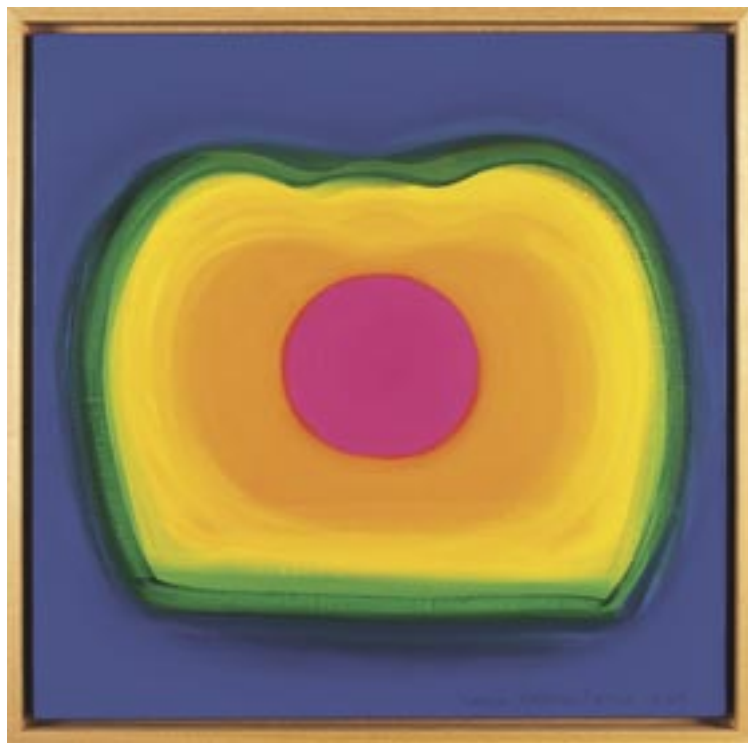
Ilona Keserü Ilona: Színváltó Elemzés 3. , 2005. (olaj, vászon, 70x70 cm)