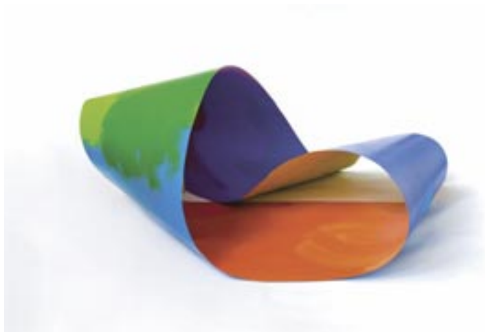
Ilona Keserü Ilona: Színváltó Titán Möbiusz , 2007. (olaj, titán ötvözet, 150x120x60 cm, változó méret)