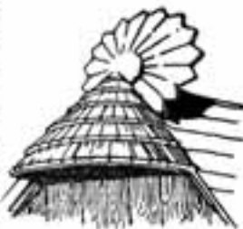
Esztergomi népvalkorral szemlélve. Benedek Károly rajza.

stílusnak, mely — pár lépéssel odább — maga is csak parthoz csapódó hulláma az életerőtől duzzadó barok pompának.