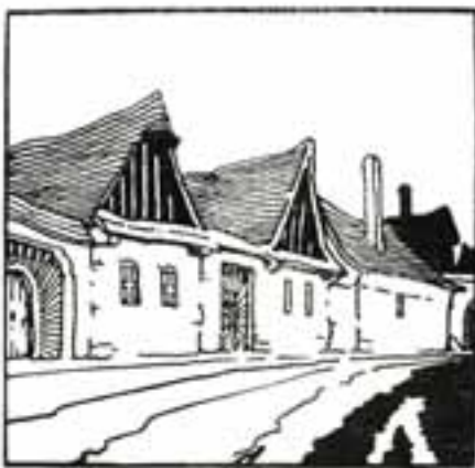
Esztergom kölvárosi utcaképe. Szendrői Károly rajza.

Hat év óta — tanítványaim egy-két kisebb csoportjával — ennek a célnak szolgálatára szenteltem a nyári hónapokat és megállapíthatom, hogy azok a névszerintegyébként közismert helyek, ahol eddig megfordultunk, műtörténeli, népművészeti és néprajzi tekintetben nem egyszer a legnagyobb meglepetésekkel szolgáltak. Ilyen meglepetés volt