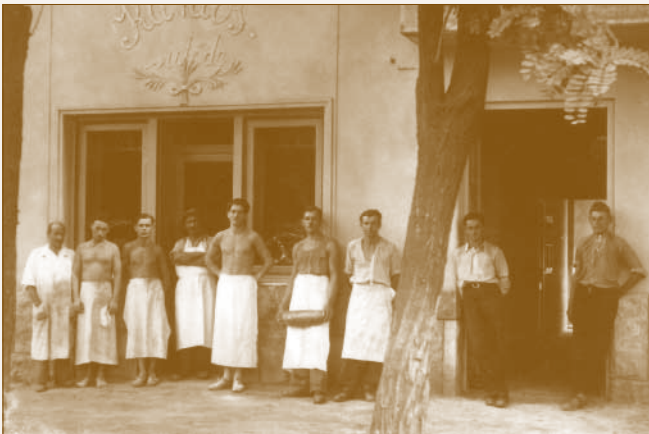
A Kardos pékség dolgozói 1940-ben

A pékségek államosítása után a „bolti kenyér” széleskörű elterjedésével még könnyebbé vált a kenyér megvásárlása, és ez fokozatosan a házikenyér megszűnéséhez vezetett. A Kardos pékségnek helyt adó ház, szépen tatarozott állapotban jelenleg is áll a Fő út és a Dr. Cseresnyés Ernő utca sarkán. E ház előtti ágyúból lötték ki 1956-ban a hős magyar tüzekek a főváros felé haladó szovjet tankot. Ezt az eseményt a ház falán elhelyezett emléktábla őrzi.