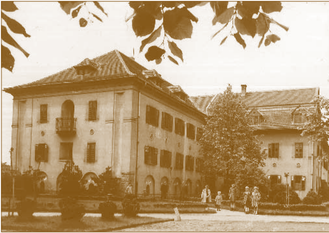
A Legényotthon épülete

A műhelyi alkalmazottaknak és azok családtagjainak a MÁV orvosi rendelést, a csecsemőknek pedig heti egy nap zöldkeresztes rendelést biztosított. 34