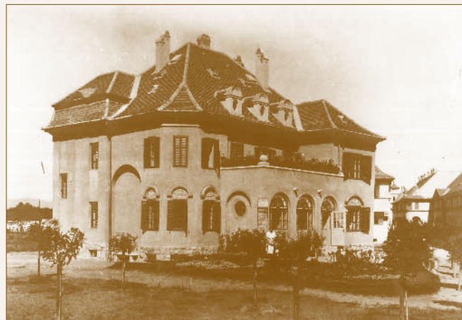
A főműhelyfőnök villája