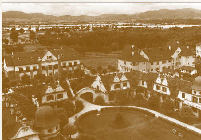
A Körönd madártávlatból, háttérben a Duna

Az épületek közül a későbbi kultúrház már az első világháború előtt elkészült. A lakóházak felépítésének első üteme 1922-ben indult és 1928-ig tartott. Ez alatt az idő alatt 44 egyszobás, 106 kétszobás, 8 háromszobás és 2 négyoszobás lakás készült el. 21 (1924. május elsején költözött be az első lakóraj a házakba.) Az épületeket különböző megoldású és fedésű zárterkélyek, barokkos kupolák, vakablakok, árkaos ívek, kapualjak, különböző állatfigurákat ábrázoló zárkövek, míviesen kialakított eresztartó konzolok, kővázák, faragott szív mintás, zöld zsalugáteres ablakok teszik változatossá. A falfelületüket néha virágokat mintázó stukkók díszítik. 22