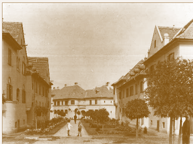
MÁV lakótelepi utcarészlet

Kotál korábban részt vett a Wekerle-telepre kiírt településtervezési pályázaton, és a megvalósításkor is több típus-terv kidolgozására kapott megbízást. 16 Egy sajátos beépítési elvet alkalmazott a dunakeszi MÁV telepen, az ún. utcás szervezést, ami erősen eltér a megszokott kolóniatömböktől. A tervező a vasútállomáshoz vezető (a mai Béke) utcáról nyitott meg egy hurokutat, és erre – valamint az üzem bejárata előtti, főtér jellegű Köröndre – telepítette az egyemeletes, rizalitokkal tagolt, laza, festői csoportokban sorakozó épületeket. Az egyes háztípusok általában párosával szegélyezik az utakat. Ferkai András szerint az épületek kialakításánál a tervező a „német kertvárosok (pl. Riemerschmidt, Metzendorf, Zimmerlei) romantikáját, illetve a magyar kisvárosok barokkját vette előképpnek.” Körner Éva az angol kertvárosok hatásának tulajdonítja a térfalak hátrahúzásával megvalósuló utcátér-szélesítéseket, valamint az utcák és épületek vonalvezetésébe beiktatott töréseket, amikkel Kotál sikeresen oldotta a párhuzamos térfalak merevségét. 17