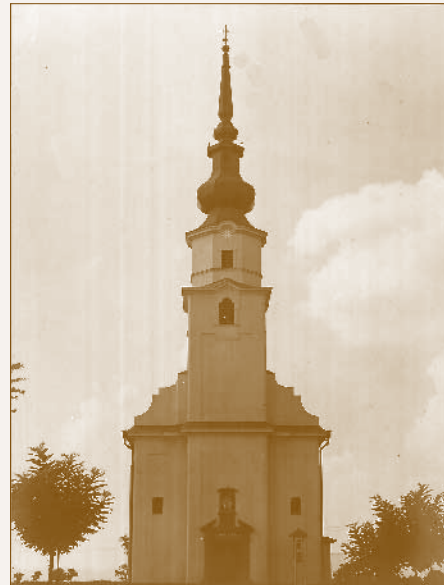
A Jézus Szíve templom

A harmincas években folyamatosan nőtt az üzem munkásainak létszáma, és Dunakeszi északi része (Révdűlő, Banktelep) is kezdett beépülni. A szükségkápolnában már nem fértek el a miséken, ezért 1939-ben templomépítő bizottság alakult, ami a lakosság adományai és a MÁV Igazgatóság anyagi segítségével 1942-től 1944-ig felépítette a Jézus szíve plébániatemplomot. 40 Az egyhajós, egytornyú, egyenes szentélyzáródású, hagyma alakú toronysisakkal koronázott neobarokk templomot Pázmándi István műegytemi tanár tervezte, aki Wälder Gyula köréhez tartozott.