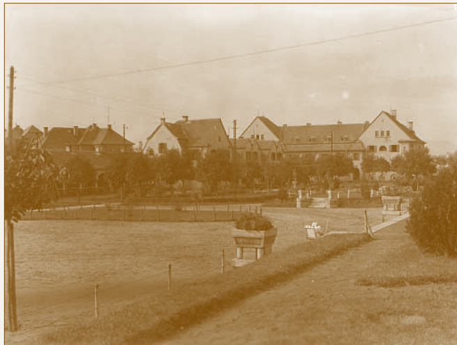
Parkrészlet a MÁV lakótelepen

telkeken épültek fel. Vidéken, pl. Miskolcon, Debrecenben önálló telkekre helyezték a lakóházakat. A többnyire négyalakos, tehát négyosztatú lakóházak 340 négyszögöles telekrészen, vagy egyedi telken álltak, és a lakásokhoz kis kertek is tartoztak. Az 1920-as évek vidéki, vasút melletti kolóniáin egyre gyakoribb lett az egyedi telkes területhasználat, ennek ellenére a Dunakeszi Főműhelyi lakótelep kétszintes épületei tömbtelkeken épültek fel. 11