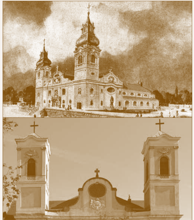
A tervezett és a jelenlegi toronysisakok

Amikor a szüleim hagyatékából előkerült korabeli színes képes levelezőlapon megpillantottam a templomunk impozáns barokk toronysisakokkal ábrázolt képét, büszkeség töltött el. Önkéntelenül is összehasonlítottam a jelenleg is látható, jellegtelen és formájában oda nem illő toronysisakkal.