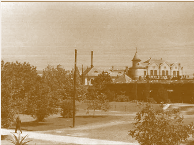
A MÁV Főműhely főbejárata, háttérben az azóta lebontott Bagolyvár

A dunakeszi főműhelyt a MÁV vezetése kezdetől fogva egy lakóteleppel együtt képzelte el, amely elkülönül a település hosszabb idő alatt, spontán kialakult szövetétől. Ezen a kolónián kívánták modern, egészséges és alacsony bérleti díjú lakásokhoz juttatni a „zöldmezős beruházásként” felépülő üzem munkásait és tisztviselőit.