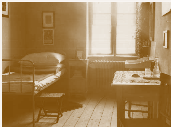
Szobabelső a Legényotthonban

Az ötven ágyas Legényotthon az egyedülálló főműhelyi dolgozók részére épült. A legényemberek központi fűtéssel fűtött, 30 két- és egyszemélyes, puritán módon berendezett szobákban laktak, 31 és a közös konyhában elektromos főzőlapokon főzhettek maguknak. 32 A szobákat naponta takarította a személyzet, akik kéthetente az ágyneműt is lecserélték. 33