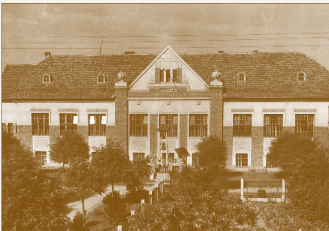
A MÁV műhelytelepi elemi (ma Bárdos Lajos) iskola

A hitélet gyakorlósa érdekében a műhelytelepi katolikus egyházközség az 1928-ban felépült elemi iskola alagsorában egy szükségkápolnát alakított ki. 38 A protestáns híveknek a