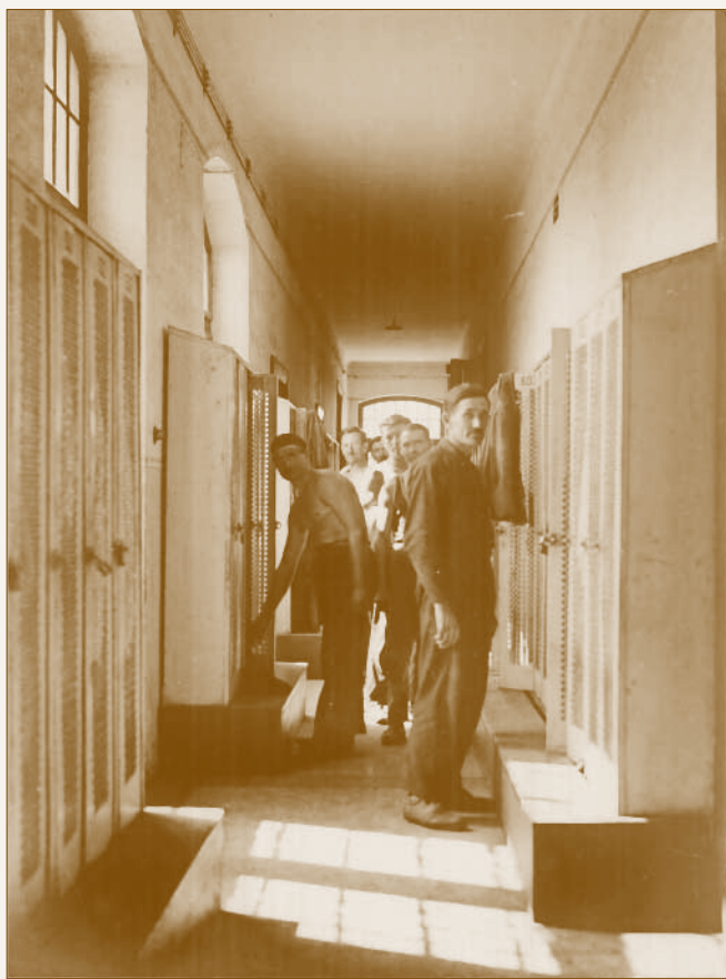
A munkások öltözője

a személykocsijavító-osztály teljes személyzetét (780 főt) 37 , akik 1926. május 25-én különvonatokon, Lányi Ferenc vezetésével Dunakeszire költöztek. 38