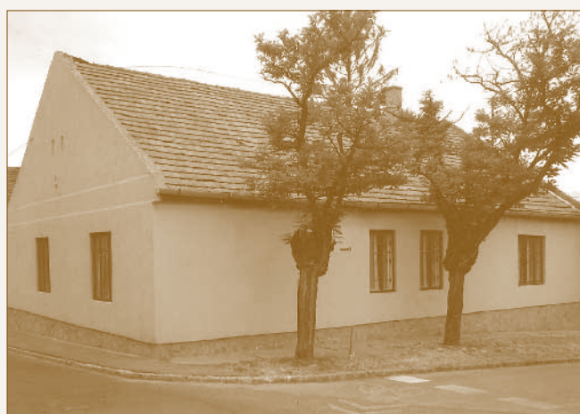
A gyűjtemény új helye, a Szent István u. 48. alatt

2012. szeptember 29-én a gyűjtemény a Szt. István u. 48. szám alatt álló „Kántorházba” költözött. Noha a hely itt sem elegendő, de mégis stílszerűen a város szívébe, a legősibb színhelyre került. Az új otthon falán a Tóth Mariska Hagyományörző Alapítvány 2014 novemberében emléktáblát is elhelyezett.