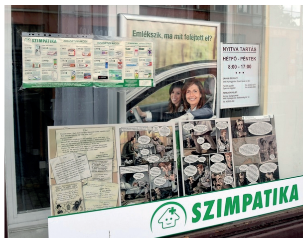
2. ábra Képregények a város üzleteiben (részlet), 2021

A Móricz Zsigmond Színház több mint 20 éve szervezi a VIDOR Fesztivált. A Vidámság és Derű Országos Seregszemléje az egyik legkedveltebb rendez-