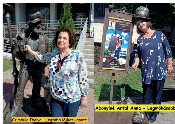
4. ábra Nyertes szelfizők, 2021

A napjainkban alkotó, legkiválóbb magyar képregényrajzoló munkáiból nyílt kiállítás a könyvtár kamaratermében. Huszonegy olyan alkotó művei kerültek bemutatásra, akik ma meghatározó szereplői a hazai képregénykiadásnak. Többen közü-