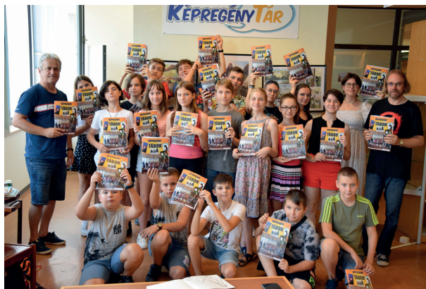
6. ábra Táborozók csoportkép, 2021.

Az előző évhez hasonlóan, 2022-ben is csatlakoztunk a VIDOR Fesztiválhoz. Hasznos és tanulságos program volt a Firkadélután VIDOR Fesztivál