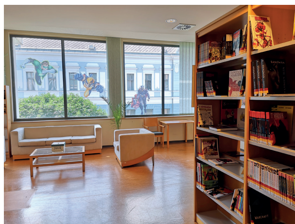
1. ábra KépregényTár, 2021

Az Olvasóteremben a Hírlapolvasót alakítottuk át, a meglévő bútorzatot (folyóiratállomány, könyvespolcok, ülőgarnitúra) átrendezésével, a megfelelő tér kialakításával, saját költségvetésből. Beszereltük a képregények alapállományát, majd tovább bővítettük a teret és önálló galériát alakítottunk ki, ahol a képregény alkotók, illusztrátorok és animációs rendezők munkáiból hozunk létre kiállításokat, közönségtalálkozókat. Rendezvényeink alkalmával látogatóink személyesen ismerkedhetnek meg az alkotókkal és alkotói módszereikkel. Ezek a beszélgetések inspirálóan hatnak látogatóinkra és a beszélgetések során kiderül, hogy többen foglalkoznak forgatókönyvek írásával, képregények rajzolásával (1. ábra). 1