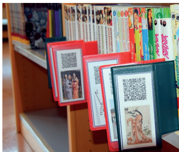
8. ábra QR-kódok a képregények között, 2022)