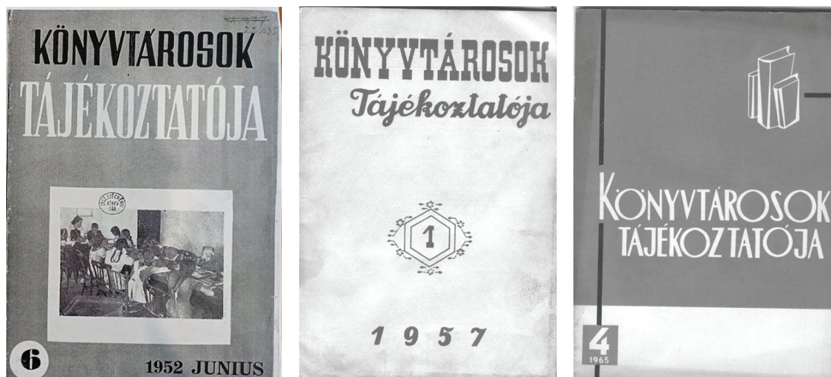
1. ábra Könyvtárosok Tájékoztatója

A román nyelvű könyvtári szaklap, a Călăuza Bibliotecarului 12 1966-tól Revista Bibliotecilor 13 név alatt jelenet meg. Társalap lévén, a Könyvtárosok Tájékoztatójának utóda a Könyvtári Szemle lett, amely szintén Bukarestben jelent meg 1966. jan./márc. (10. évf. 1. sz.) – 1973. okt./dec. (17. évf. 4. sz.) között. (2. ábra)