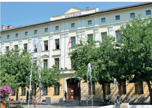
A múzeum épülete