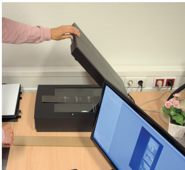
1. ábra EPSON Perfection V850 Pro síkágyas szkennert

A digitalizáláshoz több fajta szkennert áll rendelkezésre. A szkennert kiválasztása a dokumentum típusától függ, az állományvédelmi szempontokat maximálisan szem előtt tartva. A könyvjellegű anyagok digitalizálása Zeutschel OS 12002 szkenneren történik, mely az állítható könyvbölcső és a dokumentumkímélő lezörítő üveglap segítségével alkalmas a kényesebb anyagok digitalizálására. A fényképek, diafilmek és egyéb negatívak szkennelésére EPSON Perfection V850 Pro síkágyas