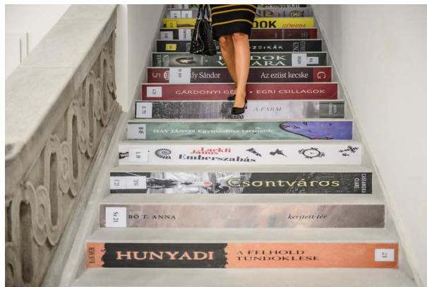
Lépcső az egri egykori Helyőrségi Művelődési Otthonban, a Bródy Sándor-könyvtár épületében. Mi lesz a következő lépés?