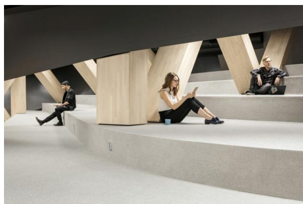
Oodi, Helsinki új könyvtára. Építész: ALA Architects.

lönböző méretű üvegfülkékben audiovizuális és számítógépes eszközök, tárgyalók, stúdió felvételre alkalmas helyek találhatóak, amelyek előjegyzéssel rendszerrel, de ingyenesen kibérelhetők. Csomó kicsi zug van itt, ahova a látogató befészkelheti magát. A fülkékben ottjártamkor a legkülönbözőbb tevékenységek folytak: születésnaptól kezdve családi karaoke és a tinédzser fiúk kedvence FIFA játék futott. Ez a szint egyben maker-space is: kirakott varrógépek, 3D nyomtatók és más eszközök azt a célt szolgálják, hogy a használók behozott tárgyaikat megjavíthassák vagy átalakíthassák, kreatív ötleteikkel másokat is arra inspirálhassanak, hogy elhasznált tárgyaikkal még lehet kezdeni valamit.