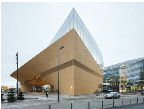
Oodi, Helsinki új könyvtára. Építész: ALA Architects.

hették meg. 2600 látogató 2400 véleménye érkezett be a kiállítás során. Nem a laikusok véleménye alapján választottak győztest, hanem szakértői zsűri mérlegelt: a közvélemény csak egy szempont volt a sok közül. A pályázat második fordulójában 6 pályamű került megmértetésre. A közönségszavazás ebben a fordulóban is hasonlóan zajlott. A közösségi folyamat fontos pozitív eredménye a kiíró szerint, hogy az építést érdeklődő figyelem és pozitív várakozás fogadta mindvégig, és részben ennek tudják be, hogy az eredetileg tervezett napi 10 000 látogató helyett 12–13 000 embert is számláltak már. Az új könyvtár közkedvelt hely.