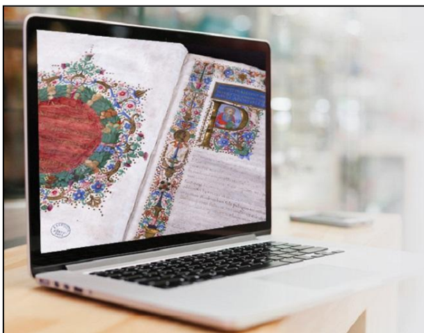
Múzeumi dokumentum digitalizálva

lag is adminisztrálható. Úgy működik tehát, mint az emberi szervezet. Minden szervnek saját feladata van, de a szervek egy rendszert alkotnak, és végül élő szervezetté állnak össze.