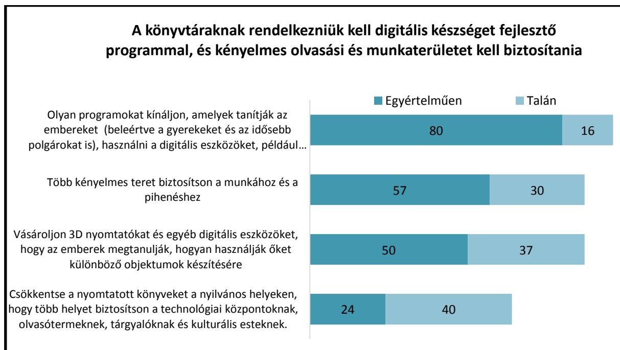
3. ábra Pew Research Center felmérése 2016. Amerika 7

A digitális technológiához való hozzáférés biztosítása mint könyvtári feladat, nemzetközi szinten is megjelenik igényként: