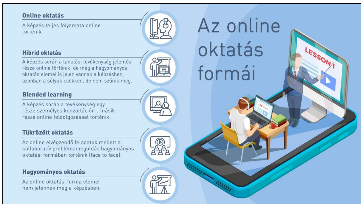
5. ábra Az oktatási formák változatai 22