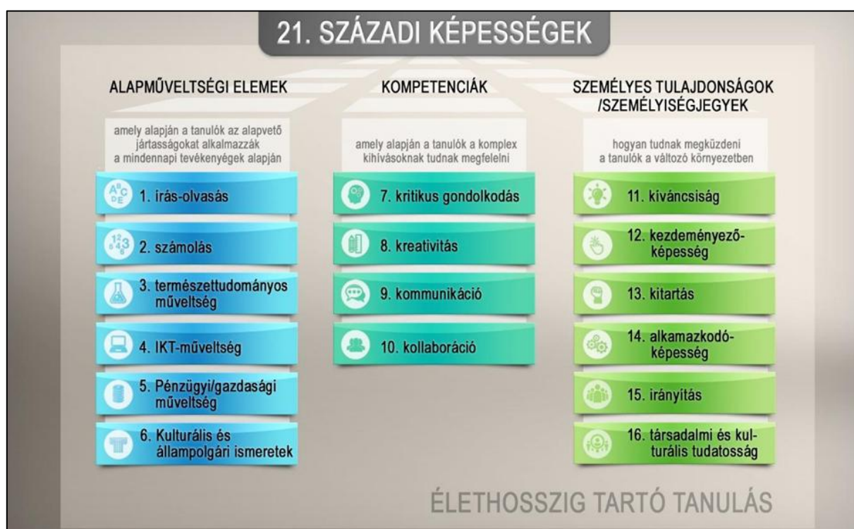
4. ábra 21. századi képességek

Látható, hogy az írás-olvasás alpműveltségi területek mellett az IKT-műveltség (valamint a könyvtárak jövője szempontjából nem elhanyagolható: Kulturális és állampolgári ismeretek) is megjelenik mint alpműveltségi elem. Az IKT-műveltség, vagy a szakirodalomban több helyen digitális írástudásként megnevezett alpműveltségi elem fejlesztésében a könyvtáraknak aktív szerepet kell vállalniuk!