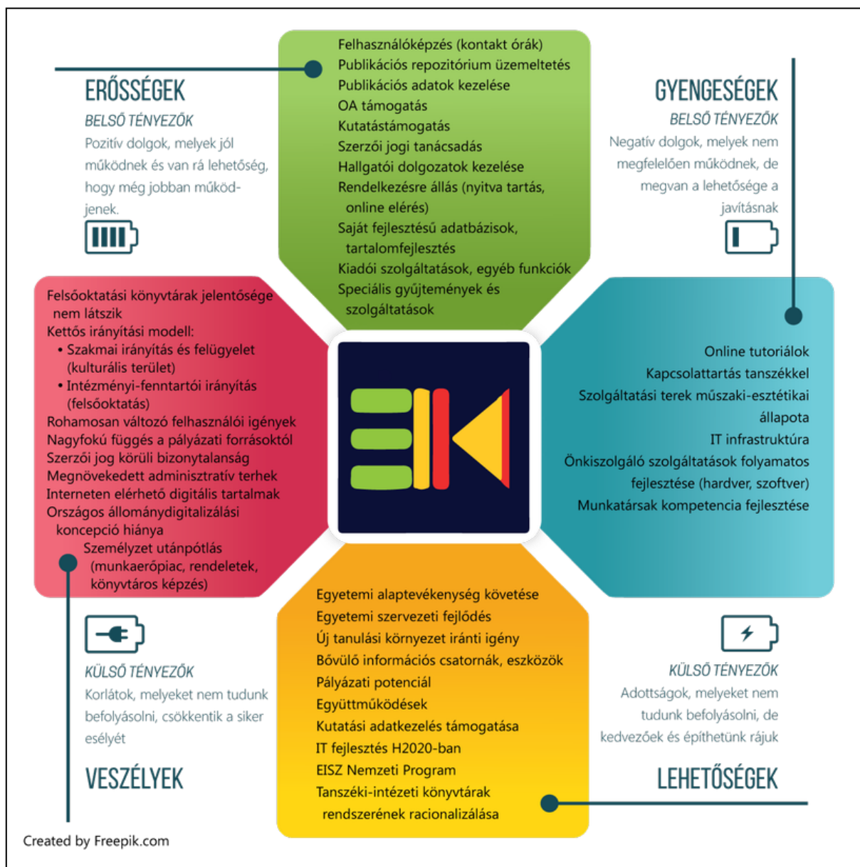
1. ábra SWOT-elemzés

tetlennel. A különbségek ellenére összességében korszerű szolgáltatáspalettát kínál, sok területen alulfinanszírozott, vegyes fizikai terekkel, közepesen elavult informatikai felszereltséggel és együttműködésre nehezen képes könyvtári informatikai rendszerekkel működő intézményhálózatról beszélnünk. Komoly problémát jelent a megfelelő erősségeiről és lehetőségeiről, amelyeket akcióterveikbe építve ellensúlyozhatják az olyan belső gyenge pontokat és a külső veszélyeket, mint a tudással és készségekkel rendelkező munkaerő felvétele és megtartása.