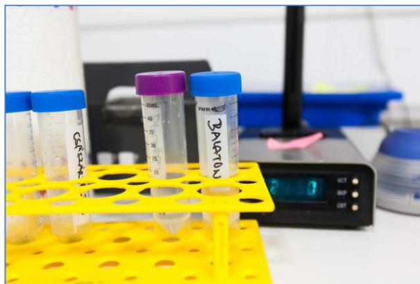
A múlt század 70-es éveitől kezdődően a Balaton kutatása – elsősorban annak rohamosan romló vízminősége miatt – elsőbbséget élvezett

Az intézetben elért ezzel kapcsolatos eredmények, valamint kutatóinak tanácsai ösztönözték arra a mindenkori kormányzatot, hogy nagyarányú környezetvédelmi és hidrológiai beruházásokkal és törvényi szabályozással megállítsa a Balaton vízminőségének további romlását. Mintegy két évtizedes következetes munka és az intézettel való együttműködés eredményeképpen ma már látható a végeredmény: tiszta, átlátszó tóvíz, rendezett partvidék és fejlődő, virágzó turizmus, idegenforgalom.