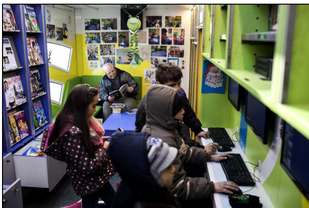
A pécsi Csorba Győző Könyvtár mozgó könyvtárusza Gerdén