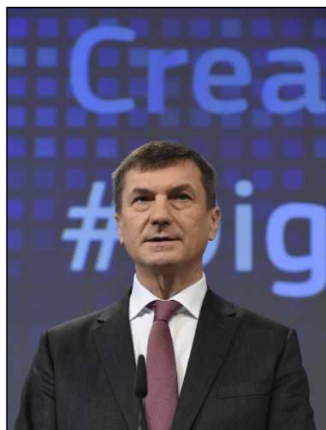
Andrus Ansip

nénk, ha a sajtótermékek kiadói hasonló jogosítványokat kapnának, mint amilyenek az unióban belül a film- és zenekiadók, vagy épp a televíziós közvetítések kapcsán már érvényben vannak. Az új szabály elismeri, hogy a kiadók komoly anyagi befektetések mellett fontos szerepet játszanak a minőségi újságírói tartalmak előállításában, amelyek elengedhetetlenek a mi demokratikus társadalmunk számára. Így sokkal jobb pozícióból ülhetnek le tárgyalni az internetes tartalomszolgáltatókkal, hogy milyen keretek és feltételek mentén tegyék elérhetővé saját cikkeiket, anyagaikat, egyúttal könnyebben tudnak fellépni a szellemi javak lopása ellen.