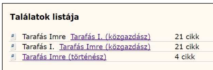
4. ábra Tarafás szerzőre keresve az eredmény a MATARKA-ban