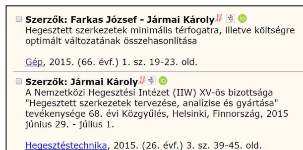
6. ábra Markerek a szerzők neve mellett