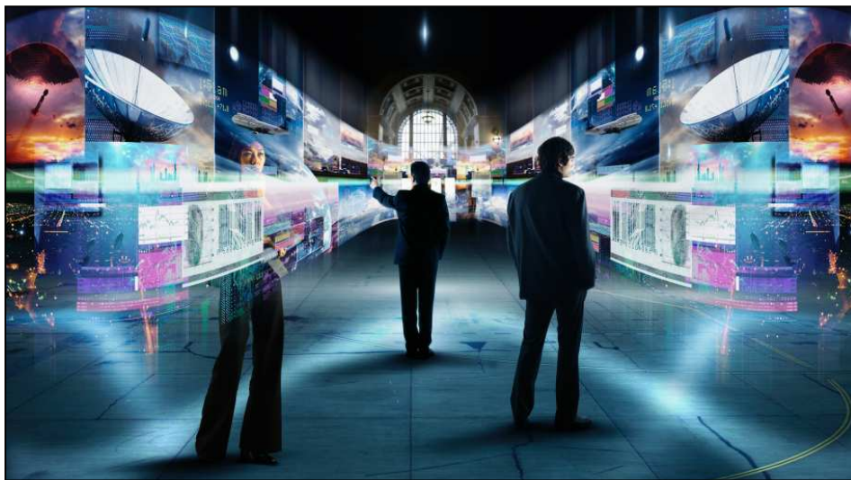
1. ábra Virtuális környezet: könyvek, múzeumok, ismerettárak hová lesznek ebben a világban?

Megfogalmazódik az aggodalom is: a digitalizációs szereplők széthúzása kulturális sokkot idézhet elő, a művelődésre, tudásra épülő társadalmaknak (azt hittük, csak ilyenek lesznek a XXI. században, ebben is csalódtunk) akár civilizációs hanyatlással kell szembenéznük, a várt és logikus fejlődés helyett. „Mivel a digitális világ nagyon komplex, tünékeny és sokszereplős terület, a tartalmak előállítói és szolgáltatói, az informatikai és internetes vállalkozások, a közgyűjtemények és más kulturális, tudományos szervezetek, valamint a jogalkotók összehangolt munkájára lenne szükség ahhoz, hogy a 20. század vége és a 21. század eleje ne egy újabb sötét középkor legyen az emberiség történetében, amelyből alig maradnak fenn írásos és egyéb típusú digitális dokumentumok” – áll a tanulmányban.