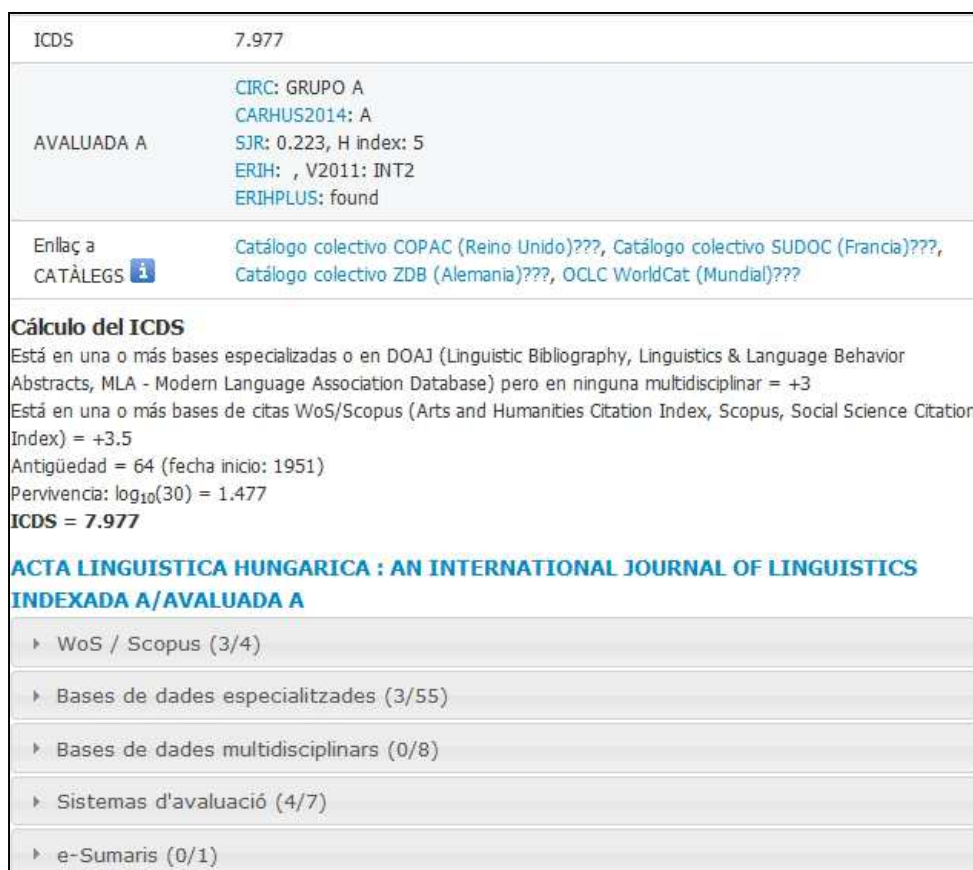
5. ábra MIAR: Az Acta Linguistica Hungarica tudományometriai profilja Forrás: http://miar.ub.edu/issn/1216-8076

minőségi kritériumok megléte esetén a kiadvány felkerülhet a másodlagos terjesztést elemző indexre. A frissítésekről, ahol erre lehetőség van, automatizmusokkal gondoskodnak. Írásom időpontjában kereken 100 magyarországi folyóirat e módszer szerinti analizálása is megtalálható a mátrixban, a Könyvtári Figyelő például 4,477, a Tudományos és Műszaki Tájékoztatás (TMT) 6,477 ICDS értékkel szerepel benne ( http://miar.ub.edu/ISSN/0023-3773 ; http://miar.ub.edu/ISSN/0041-3917 ), a TMT magasabb diffúzióját a FRANCIS és a PASCAL multidiszciplináris adatbázisokban való jelenléte eredményezi. A címekeknél az évenkénti kiadások mutatói is kísérhetők, így az is látható, ha változás állna be a bejegyzett szétsugárzó vállalkozások érdeklődésében az adott lap iránt, illetve teljesebbé/pontosabbá válna a folyóiratcímhez kapcsolható indexelők katasztere. Szélesen elterjedt, nemzetközi (A, INT) kategóriás lapnál a nemzetközi indexelők fontosabb tudományometriai adatait is átvezetik: az Acta Linguistica Hungarica profilján például megjelennek az IF, a h-index és a listás besorolások is ( http://miar.ub.edu/ca/ISSN/1216-8076 ) (5. ábra).