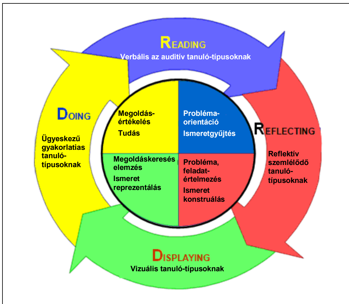
2. ábra A tevékenységeket az R2D2 szimbólumokkal fejezi ki

A modell több gyakorlati megvalósulása is elkészült, a leglényegesebb egy kereshető, címkékkel (tag) feltárt linkgyűjtemény (3. ábra), amelyhez a delicious online könyvjelző alkalmazást használtam.