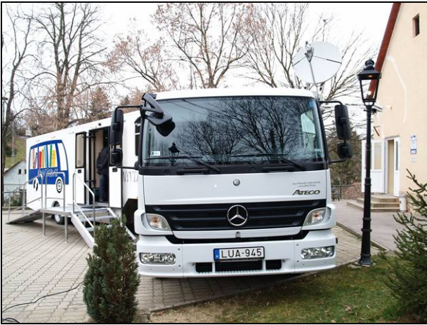
1. ábra A Könyvtárbusz