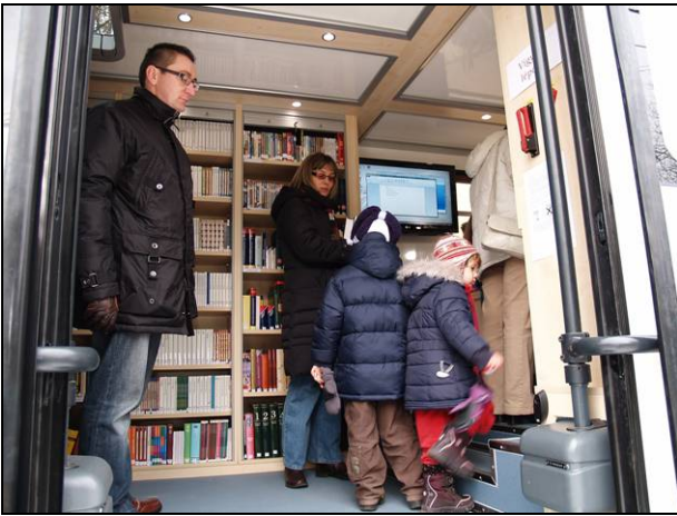
2. ábra Mozgókönyvtári szolgáltatás

A korszerű könyvtári szolgáltatás ezzel a járművel – 2011-től rendszeresen, havonta kétszer 1,5-1,5 órában – két teljes szolgáltatási kört teljesítve (9 útvonallal 27 települést érintve, l. a 3. ábrát) jut el a