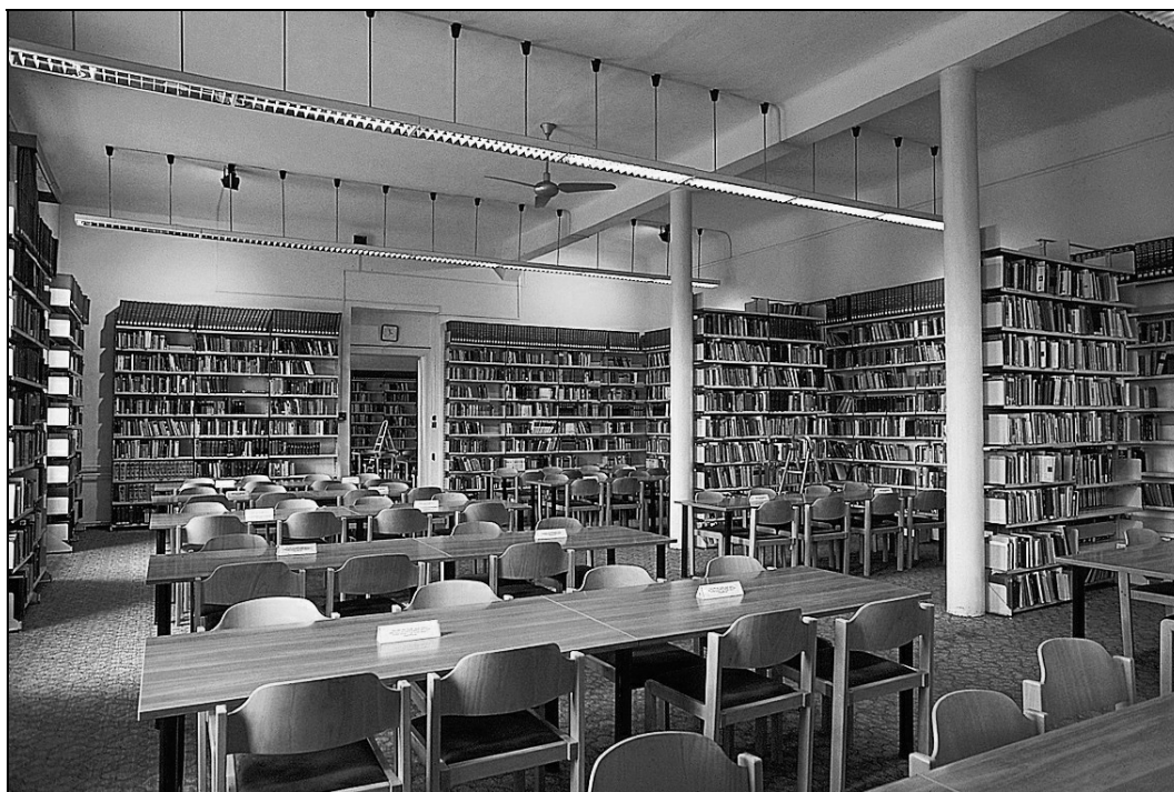
2. ábra A könyvtár olvasóterme az átköltözés előtt

Új épület iránti óhajok, megvalósítási álmok az 1921-ben működését megkezdő egyetemen persze gyakorta felmerültek. 1930-ban „feltétlenül megoldandó kérdés”-nek vélik az Egyetemi Könyvtár elhelyezését, „a legméltóbb helye a Templomtér körül lenne...”, majd 1938-ban s a későbbiekben is felbukkanó elképzelés szerint a legjobb volna „a Város Könyvtárának és az Egyetemi Könyvtárnak egy közös épületben való elhelyezése”. A világháború elsősorban gazdasági, az azt követő két évtized a tudományt, a felsőoktatást érintő elsősorban ideológiai okokból komolyabb kezdeményezést új épület ügyben nem tett lehetővé. Némi változást jelentett, hogy 1966-ban az akkor mindenható megyei pártértekezlet előtt van a Somogyi-könyvtárral közös új épületterv, két év múlva ezt a beruházási javaslat követi, majd újabb két év múlva már a tervpályázat eredményhirdetése is megtörténik. 1972-ben viszont az egyetem az, amely a megvalósítástól pénzügyi okokból visszalép, s újabb húsz évnek kell eltelnie, hogy a 90-es évek eleji, a rendszerváltozással összefüggő reformhangulat és lelkesedés újra felszínre hozza az új könyvtár építésének múlhatatlan szükségességét. Ez több akkor született dokumentumban (pl. Jámbor szándék egy új egyetemi könyvtári épületről , illetve a Javaslat az Egyetem – majd később Universitas – új könyvtári szerkezetére ) is megfogalmazódik.