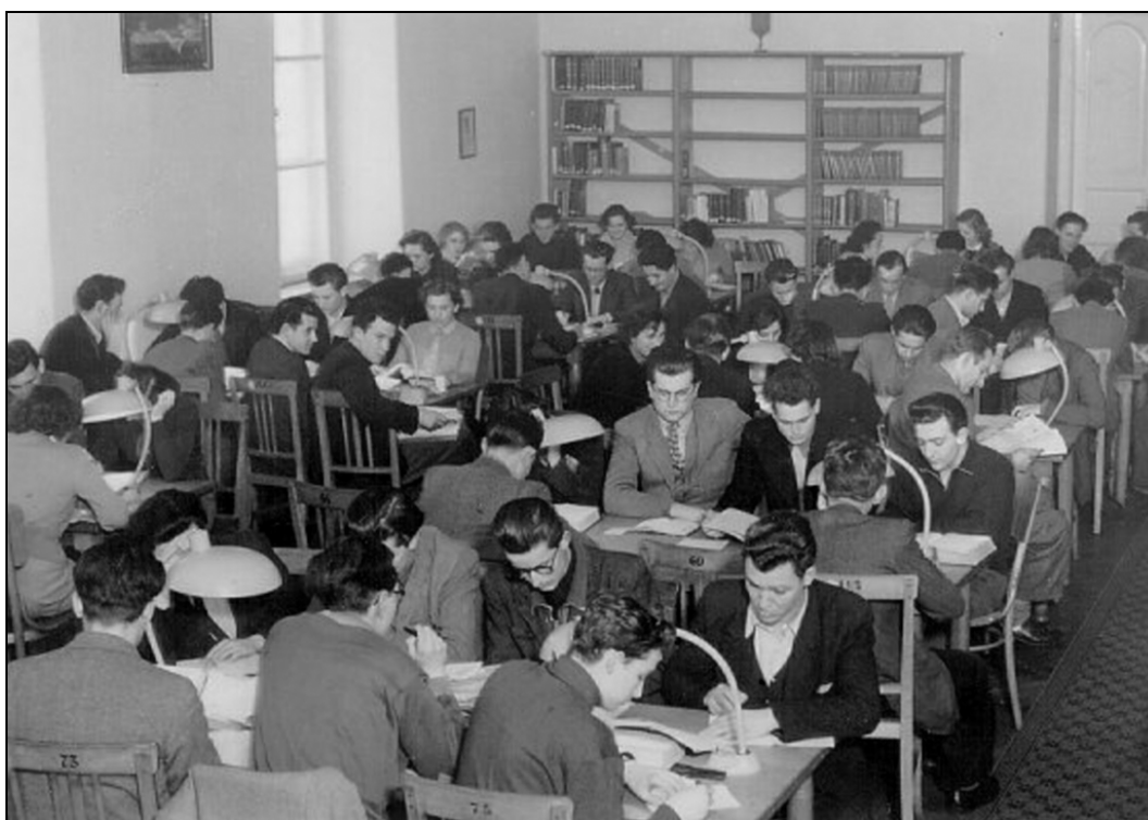
1. ábra A könyvtár olvasóterme az 50-es években

Könyvtár létrehozása Szegeden ugyanis a funkciót ellátni tudó, erre a célra tervezett könyvtárépület megépítése nélkül történt (1. ábra). A könyvtár 2004 előtti története ennek következtében folyamatos erőlködés volt egy olyan szakmai alapszint eléréseért, amelyet más, szerencsésebb csillagzat alatt létrehozott könyvtárak eleve teljesítettek; folyamatos és hatalmas energiákat elfogyasztó küzdelem volt azért, hogy a hátrány ellenére a könyvtár kiszolgálja egyetemét (2. ábra) és a hazai könyvtárügy élvonalában is számon tartsák.