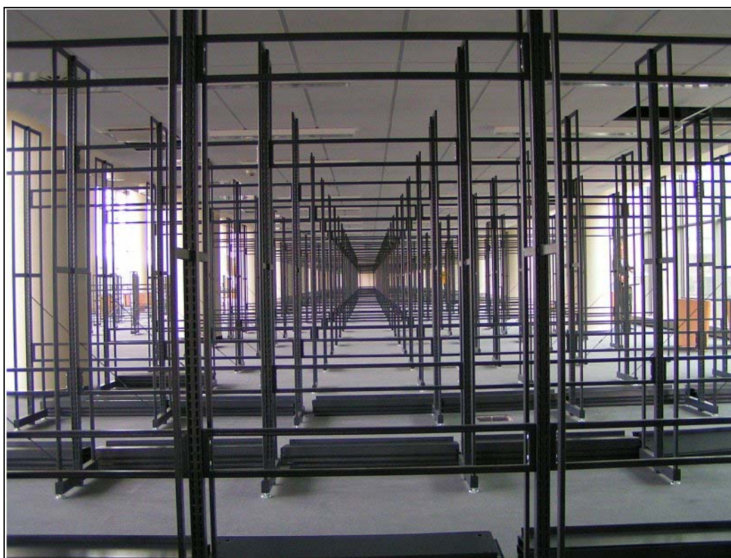
4. ábra Polcerdő, még üresen

A könyvtárak jövőjét illető kihívások, a válaszul megfogalmazódó nemzetközi fejlesztési trendek, a helyi, szegedi egyetemi sajátosságok és elvárások ismeretében kialakított tervezési útmutató ( A Szegedi Tudományegyetem Tanulmányi és Információs Központja. A meghívásos építészeti tervpályázat tervezési programja. Szeged, 2000. 64 p. ) nyomán elkészített terv eredménye az egyetemi polgárok számára 2004. december 9-én, a nyitás napján volt először látható. Mielőtt az épület rövid szóbeli bemutatásába fognék, a történeti hűség kedvéért egy sokak által felvetett kérdés tisztázását kísérem meg.