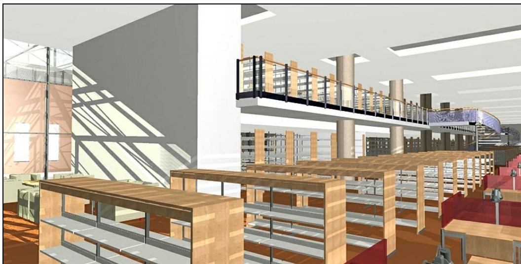
3. ábra Az új könyvtár építészeti terve: olvasóterem

Az elméleti háttér igencsak gazdagon állt rendelkezésre. Szakfolyóiratok cikkeinek, szakkonferenciák anyagainak tanulmányozása világossá tette, hogy abból a tényből kell kiindulnunk, hogy kihívásokkal teli jövő várja a megváltozni képes könyvtárakat. Világossá vált, hogy a felsőoktatási könyvtárak több lehetőséggel is élhetnek e kihívásokra válaszul. Egyik lépés a digitális könyvtár kialakítása a digitális oktatás–tanulás környezetének természetes kiegészítőjeként (ez nagy segítség az oktató számára, az adott kurzus számára, a megfelelő források biztosítására). Lehetőség a digitális hallgatói portfóliók kezelése, indexelése és integrálása a könyvtár egyéb információs forrásaival. Elkerülhetetlen az információhasználat oktatása a jövőben „tudásmunkásoknak” mind hagyományos, mind internethasználatra alapuló modulok segítségével, s a könyvtáros multidiszciplináris csapat tagjaként részt vehet a kurzusok tervezésében. Ugyancsak fontos lehetőség, hogy a könyvtár „tanulási központ”-ként az egyre aktívabb tanulási módszerek környezetét kiválóan képes szolgáltatni.