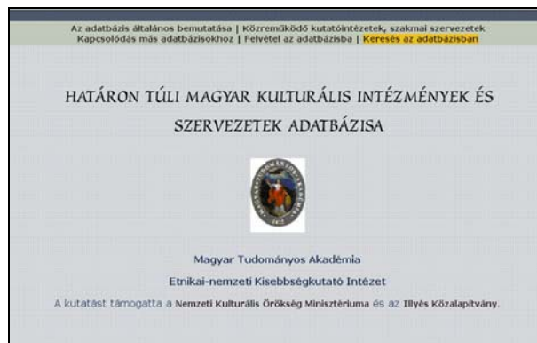
5. ábra Az Adatbázis nyitólapja