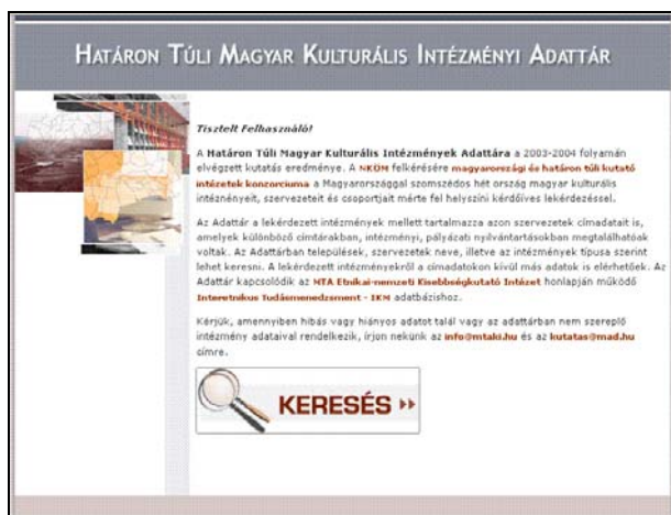
6. ábra Az Adattár nyitólapja

sésnek megfelelő találat, erről nem ír ki, az oldal változatlan marad. Első alkalommal azt gondoltam, nem nyomtam le rendesen az Entert. A találati lista aljáról nem lehet visszalépni az oldal tetjére. Az Adatbázisban , ha a találati listáról kiválasztom az egyes tételeket, azok adatlapjáról nincs „Vissza” gomb a listához, sőt a böngésző vissza nyilat használva időnként nem jutok vissza a találatokhoz, mert kiírja, hogy „A keresett lap nem található”. Az Adattárban egy „Vissza” gomb segíti a navigációt.