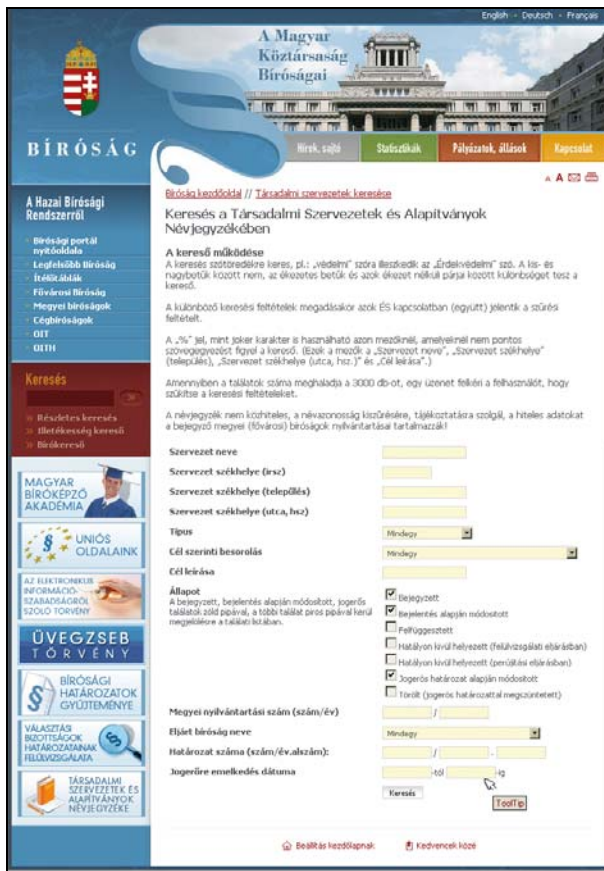
1. ábra A szolgáltatás kezdőlapja és egyben a keresőfelülete

bíróság elérési adataira, holott a bíróságok címjegyzéke is a portál része.