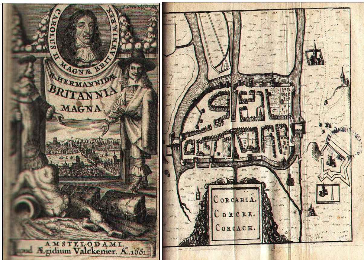
3. ábra Muzeális kötet címlapja és metszet a könyvből

A munka kiegészült a régi könyvek feldolgozásánál adódó, olyan többlet feladatokkal, mint gót betűs címek transliterálása, tulajdonbélyegzők azonosítása, possessor-bejegyzések rögzítése, ex librisek regisztrálása (2. ábra). A korai nyomtatványok azonosításának legbiztosabb módja, hogy a címlapokat, vagy a könyv egyéb részleteit digitalizált mellékletként csatoljuk a bibliográfiai tétel rekordjához (3. ábra). A Régi Muzeális (RM) téma címre kattintva a teljes, feldolgozott régi állomány végig böngészhető.