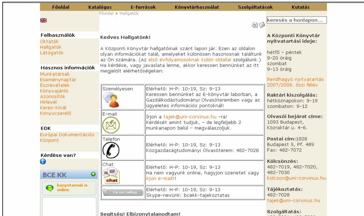
2. ábra A könyvtár honlapján a hallgatóknak kínált oldal