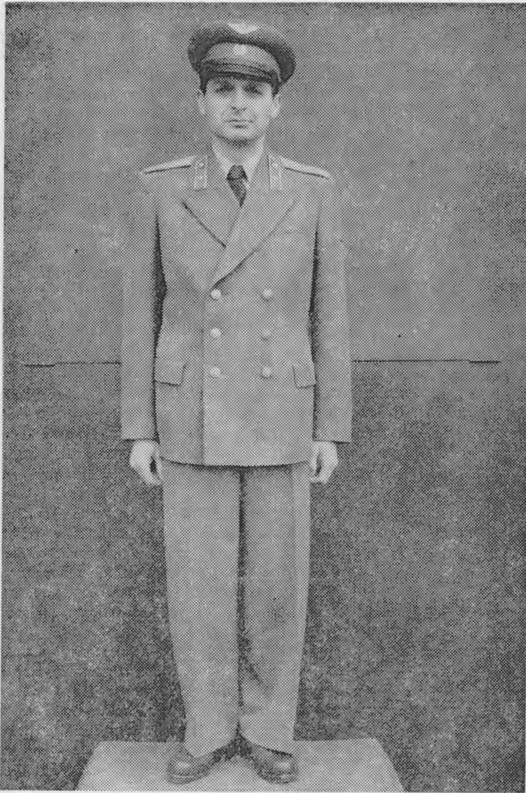
4. sz. kép