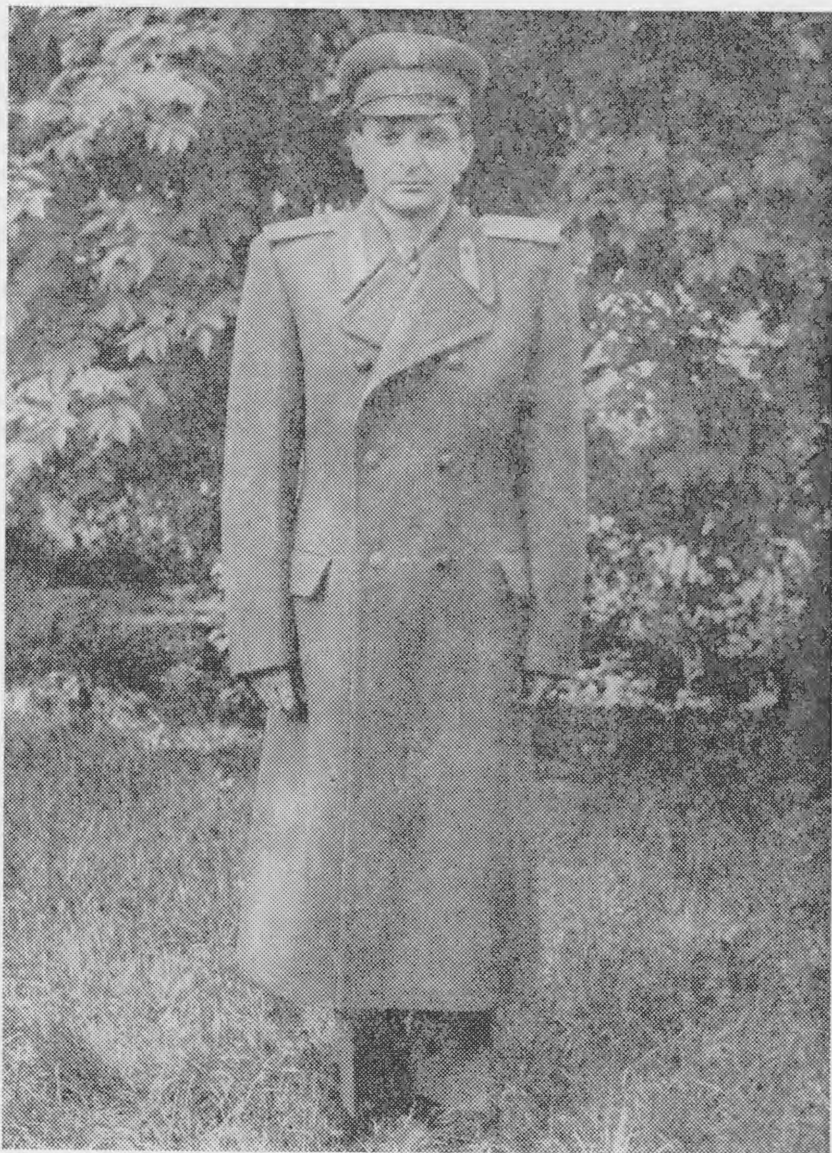
2. sz. kép 49. M. ti. és thttsi. köpeny