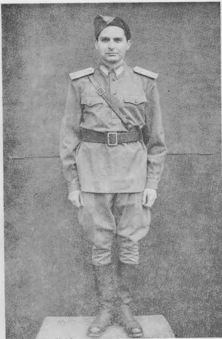
1. sz. kép

Ti. gyakorló ruházat. Ti. gyak. sapka, ti. gyak. ingzubbony, ti. gyak nadrág, ti. gyak. csizma