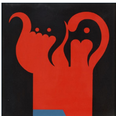
Korniss Dezső: Rablók II. , 1977