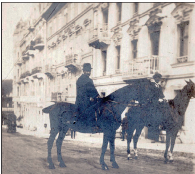
A mágnásszabó „lovasszobra”, a háttérben három palota valahol a Várban