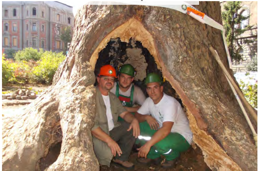
Famentők a köröndi platán odvában

őket, mint hogy a termék a nemzetközi piacon bevezetésre kerülne. Nem véletlen, hogy a világon a legtöbb fakoppos vizsgálatot a FŐKERT faápoló csoportja végezte eddig el.