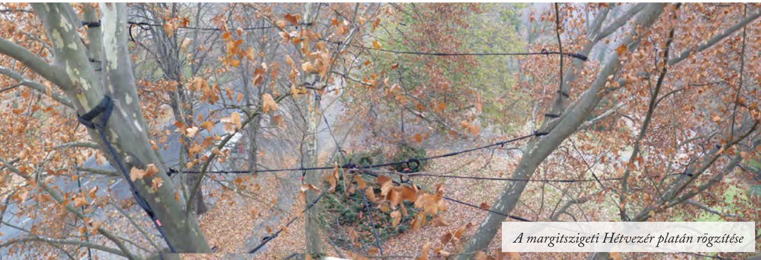
A margitszigeti Hétvezér platán rögzítése