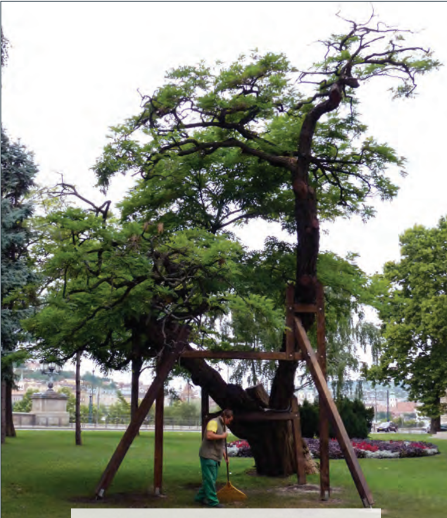
Az akácmatuszálem új támasztéka a Széchenyi téren

A FŐKERT úgynevezett csillaggyűrűs kötéssel, roncsolás nélkül teremtette meg a statikai egyensúlyt, s ebben a COBRA kapott főszerepet. A kötélet egyetlen hátránya, hogy a magas UV sugárzás idővel csökkenti a szakítószilárdságát, így nyolcévente cserélni kell.