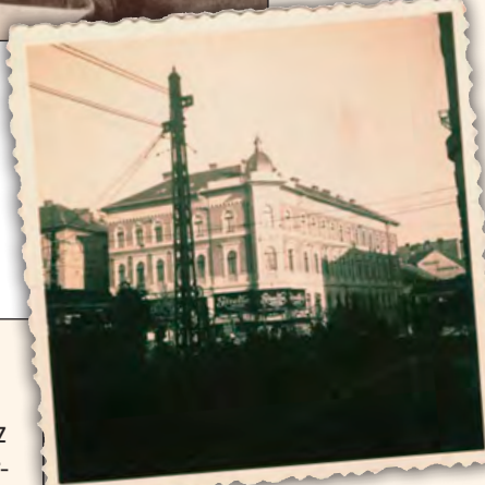
A családi bérház a Thököly úton