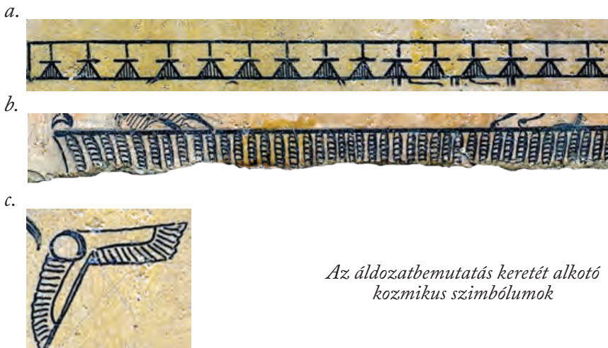
Az áldozatbemutatás keretét alkotó kozmikus szimbólumok

A sztélé fő jelenetét alkotó áldozatbemutatást különféle, kozmikus jelentésű szimbólumok határolják, és töltik ki.