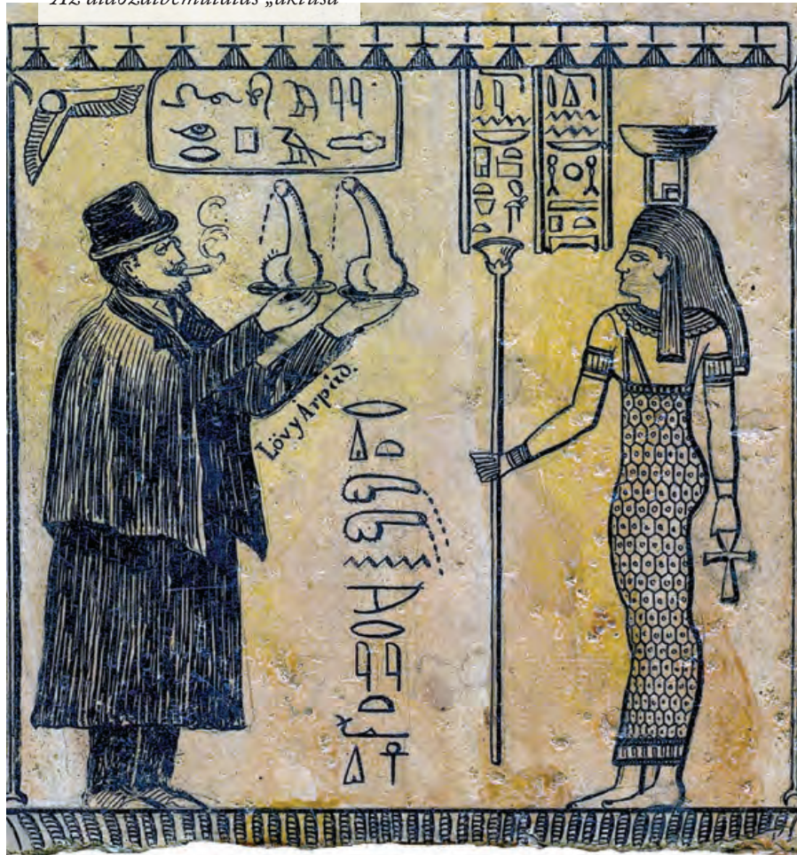
Az áldozatbemutatás „aktusa”

Az áldozatot maga Löwy mutatja be, legzetes malaclopó köpönyegében, cvikkerrel, szájában az elmaradhatatlan szivarral. Az egészalakos rajz merőben új, eredeti, egyik ismert Löwy-ábrázolás másolatának sem tekinthető.