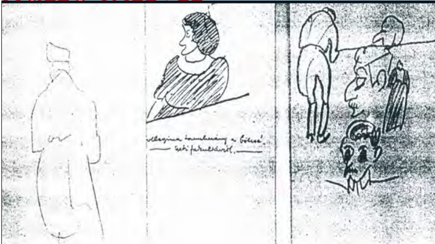
Odesszában, kórházi napjaiban rajzolta ezt az önarcképét