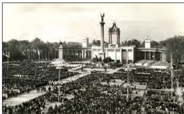
Tömeg a Hősök terén a Nemzetközi Eucharisztikus Kongresszuson. Képeslap, 1938