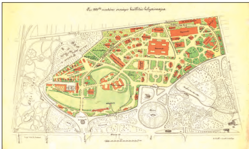
A millenniumi kiállítás helyszínrajza, 1896