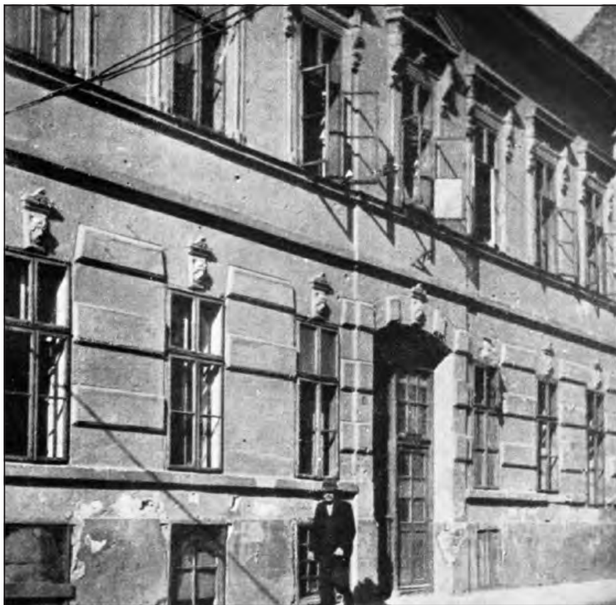
Táncsics egykori háza a Tömő utcában

gyar". E fogást nem érve, kevesen lesznek a hazában született ilyen nyelvűek közt, kik magukat „nem magyarok”-ul írják (...) főképp ha e lakosok közt elterjesztetik, hogy a tabellák azonnal kinyomatva a nyilvánosságnak adtnak át. (...) Ettől fogva sohasem lesz szükség valamely fajtörődék nyelvére egyéb tekintettel lenni (...) [A] rendőrség akadályozza meg az osztrák széleken az idegenek becsődülését általában, de különösen a fővárosra nézve még azt is eszközölje, hogy ide még a hazabeli más fajtörödékek se özönöljenek (...) az idegen nyelvűeknek máshol adva munkát. (...) A mikor e nagy munkák megkezdetnek, tudnivaló hogy kivált a felső vidéki tótság, Budapest közel környékéből a németiség özönlene a fővárosba (...) a tengerpartra a horvátság az pedig botrány volna, s könnyen ingerültséget szülhetne, minek aztán kellemetlen következményei lehetnének, ha a hivatal egyenesen ezt mondaná nekik: „ti tótok, ti németek, ti meg horvátok vagytok, tehát ide nem szabad jőnötök, itt nem kaptok munkát”, hanem a más fajtörödékbeliakat (...) más munkára kell alkalmazni (...) vaspálya készüljön, Tiszaszabályozás, a szolnoki pálya továbbvitelése sat. (...) Keményítse ön meg szívét, legyen minden magános panasza süket, ne lásson, ne halljon, ne érezzen mást csak az ország hasznát, nemzetiségünket. (...) vágjon ön ketté minden egymással összebonyolult magán érdeket.”