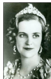
Geraldine albán királyné platina és gyémánt tiarájával.

A Magyar Nemzeti Múzeum az Albán Nagykövetséggel együttműködésben kamara-kiállításával Apponyi Geraldine grófnőre (1915–2002), a néhai albán királyné emlékezik. Geraldine 1938. április 27-én ment férjhez I. Zogu albán királyhoz. A következő év áprilisában megszületett a trónörökös is, de az albán nép által hamar közkedvelté vált királyné tündérmeséje nem folytatódhatott tovább, mert a történelem közbeszólt. Néhány nappal Leka fiuk születése után a királyi párnak menekülnie kellett, miután az országot a fasiszta Olaszország megszállta. A Magyarország fehér rózsájának is nevezett királyné nyugat-európai és dél-afrikai emigrációja után élete végén visszatérhetett fiával Albániába. A kiállítás archív fényképek segítségével mutatja be Geraldine életét, elsősorban az 1938-as tiranai esküvőt állítva középpontba. Ezen kívül feltárja kapcsolatát a Nemzeti Múzeummal, ugyanis a grófkisasszony rövid ideig a Magyar Nemzeti Múzeumban dolgozott, erről a korabeli újságok is beszámolnak. ● További információ a kiállításhoz kapcsolódó programokról: www.mnm.hu/programok