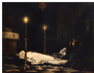
Madarász Viktor: Hunyadi László siratása, 1859 © Magyar Nemzeti Galéria

Kamarakiállítás Madarász Viktor halálának százéves évfordulójára Magyar Nemzeti Galéria, Grafikai kabinet, 2018. február 18-ig