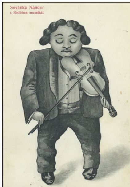
Sovánka Nándor a Bodóban muzsikál (képeslap, 1909)

sírján olvasható – először Debrecenben, 1914-ben megjelent – sírverse: A temető mellett / Vonat robog el. / Itt rohan az élet, / Ott már vesztegel. // A temető elől / Hasztalan szalad: / A végső stáció / Mégis ez marad.