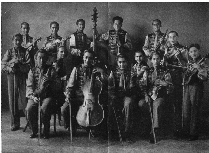
A Rajkó zenekar a Bodóban (képeslap, 1930 körül)

zése után a fővárosban telepedett le. A fehérvári és budapesti lapokban jelentek meg versei, 1896-ban a Szabad Szó című lap helyettes szerkesztője volt. Költeményeivel nem vonult be a magyar irodalomtörténetbe. A Kerepesi temetőben lévő