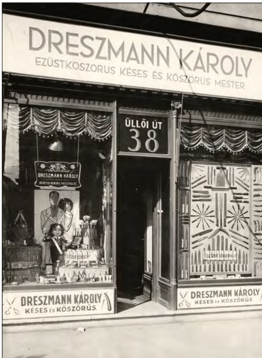
A gyár termékeinek értékesítésére két üzlet is működött a belvárosban: az Erzsébet körúton és az Üllői úton – sajnos, mára már egyik sem fellelhető.

vel. Az üzemben kezdetben 8 segéddel és 2–3 tanonccal dolgozott, majd az 1920-as években már 15–20 munkást foglalkoztatott, és termékei nemzetközi viszonylatban is elismertek voltak. Az első borotvagár Rákosfalván az Álmos vezér tér 6-ban helyezkedett el, ezt később átalakították, majd le is bontották Rákosfalva több házával együtt, ide építették fel ugyanis a Füredi úti lakótelepet.