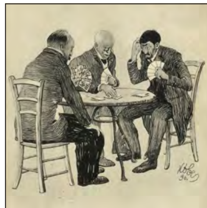
Kalabrias parti (képeslap 1901)

utca 11. telke. Egy 1873-as felmérés szerint a gyárban 50 férfi, 40 nő, 10 gyermek, 2 igazgató, 3 tisztviselő dolgozott. 100 000 tucat kártyát állítottak elő évi 300 munkanap alatt, a dolgozók heti bére 7 Ft (ami alacsonynak számított ebben az időben). A gépparkjuk 1 db 6 lóerős fekvő gőzgépből, 1 calica hengernyomógépből, 1 fényezőgépből, 1 simítógépből és 1 festékmalomból áll.