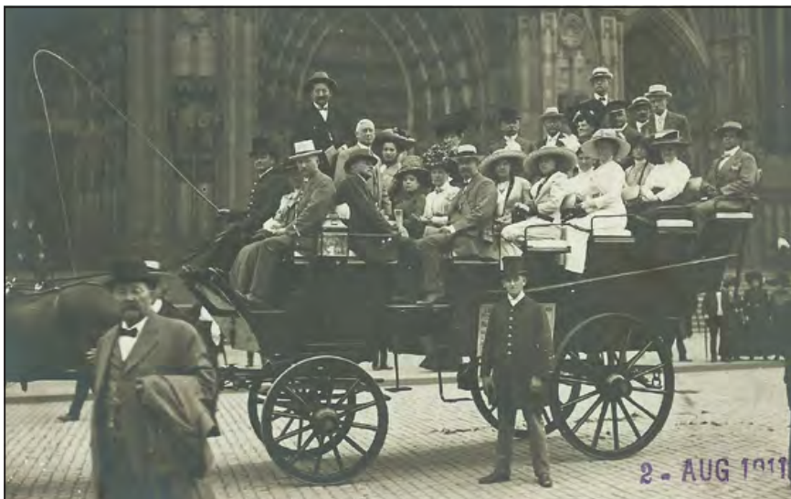
Városnéző lovaskocsi Kölnben (fotó-képeslap, 1911)

magyar csoport bécsi kirándulásra indulásának fotója. A bécsi utazási iroda átküldte autóbuszát Sopronba, hogy az ott nyaralókat (az előzőleg szervezett) egynapos bécsi városnéző túrára vigye.