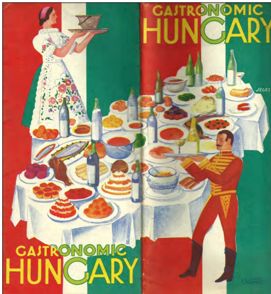
Gastronomic Hungary (Rajzos térkép, az Idegenforgalmi Hivatal kiadása, Jecsi Ernő grafikus munkája a 30-as évekből)

A huszadik század megerősítette, sőt jelentős gazdasági ágazattá fejlesztette az idegenforgalmat Európa nagyvárosaiban. Londonban például már a 20. század elejétől komoly bevétellel számolt a város vezetése, és fontos intézkedések sorozatával segítette is ezen „iparág” fejlődését. Természetesen nekünk, budapestieknek sem kell szégyenkeznünk amiatt, hogy miképpen hívtuk, vártuk és fogadtuk a ránk kíváncsi idegeneket.