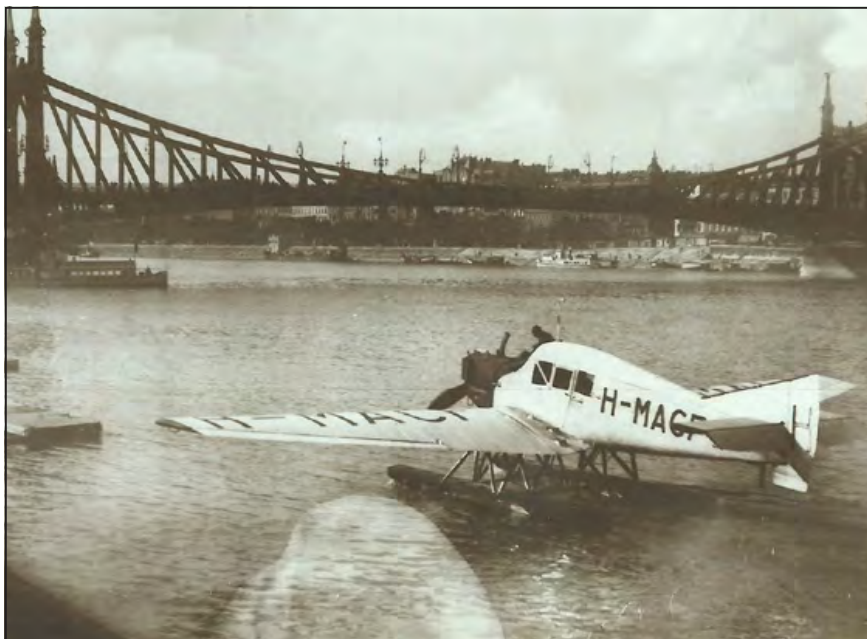
Hidroplán kikötő a Dunán a Gellért Szálló előtt (fotó-képeslap, 1930-as évek)