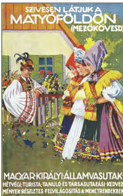
MÁV-plakát, Matyóföld (képeslap, 1929)

Az eseményt a főváros vezetői is megfelelően méltányolták. Budapest Székesfőváros Tanácsa a résztvevők tiszteletére 1926. október 1-én díszvacsorát rendezett a Gellért Nagyszállóban. Mayer János akkori földművelésügyi miniszter a Mezőgazdasági Múzeumban díszvacsorán látta vendégül a szállodásokat, Ripka Ferenc főpolgármester pedig az Állami