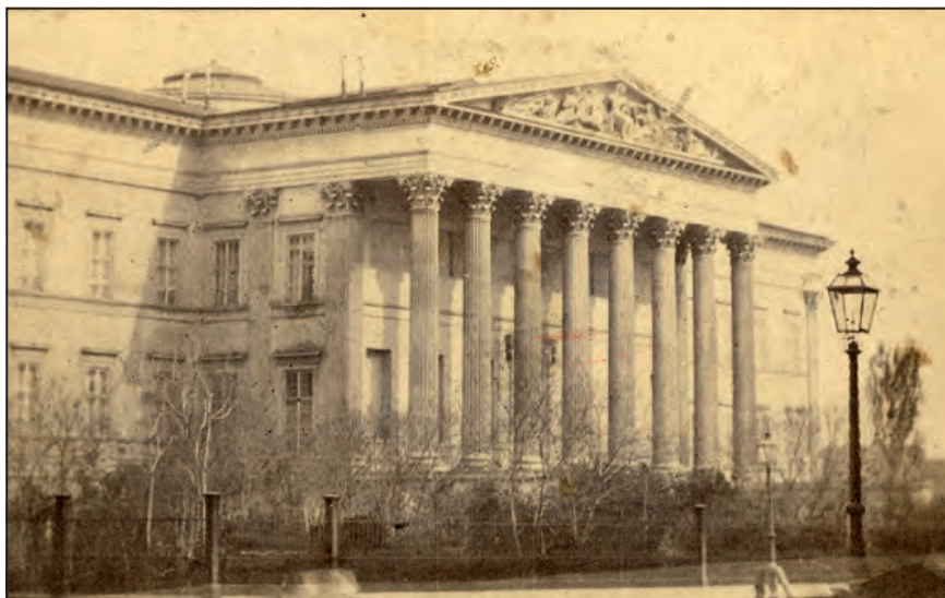
A Nemzeti Múzeum épülete az előterében álló még fiatal faegyedekkel, 1865–70 körül