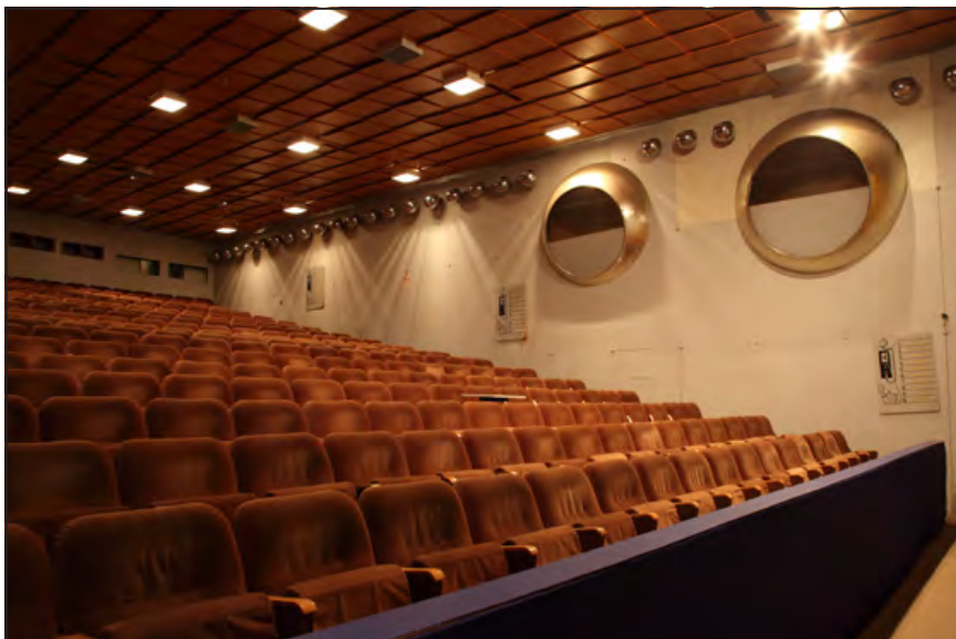
Az MKK-MTESZ tanácsterme