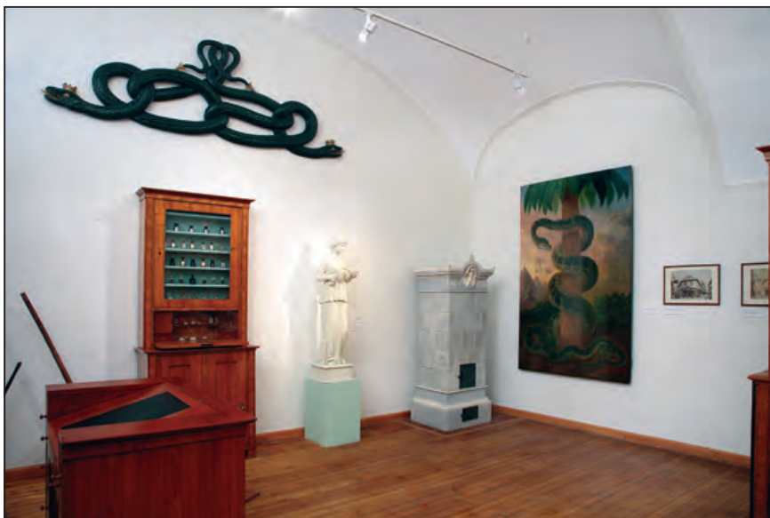
Egy Brxa-kályha a Kiscelli állandó kiállításán