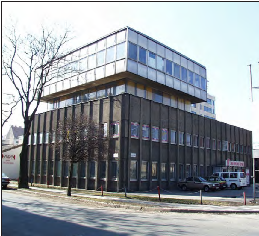
Láng Művelődési Központ

jövőben pedig csaknem féltucatnyi újabb alapkövetélethez lehet számítani. Az sem mellékes, hogy a már működő irodaházak közül több is büszkélkedhet a hazai és a nemzetközi ingatlanfejlesztő szakma rangos elismeréseivel. Mivel pedig a kerület a lakáskereső körében immár hosszú évek óta a budapesti élvonalban