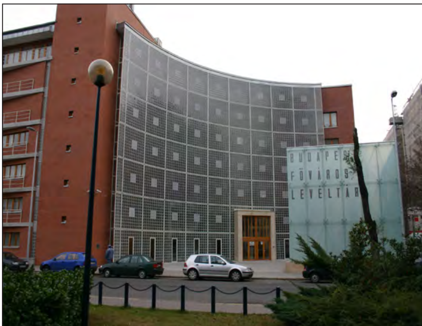
Budapest levéltárának palotája

– leginkább az első helyen – található, kiemelkedő mutató, hogy magánberuházásban jelen pillanatban is mintegy ezer lakás építése folyik a városrészben.