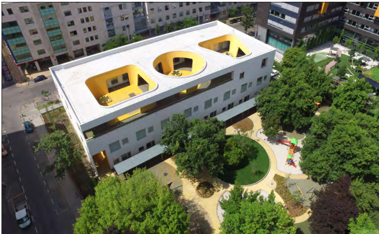
A Mesékert kívül-belül